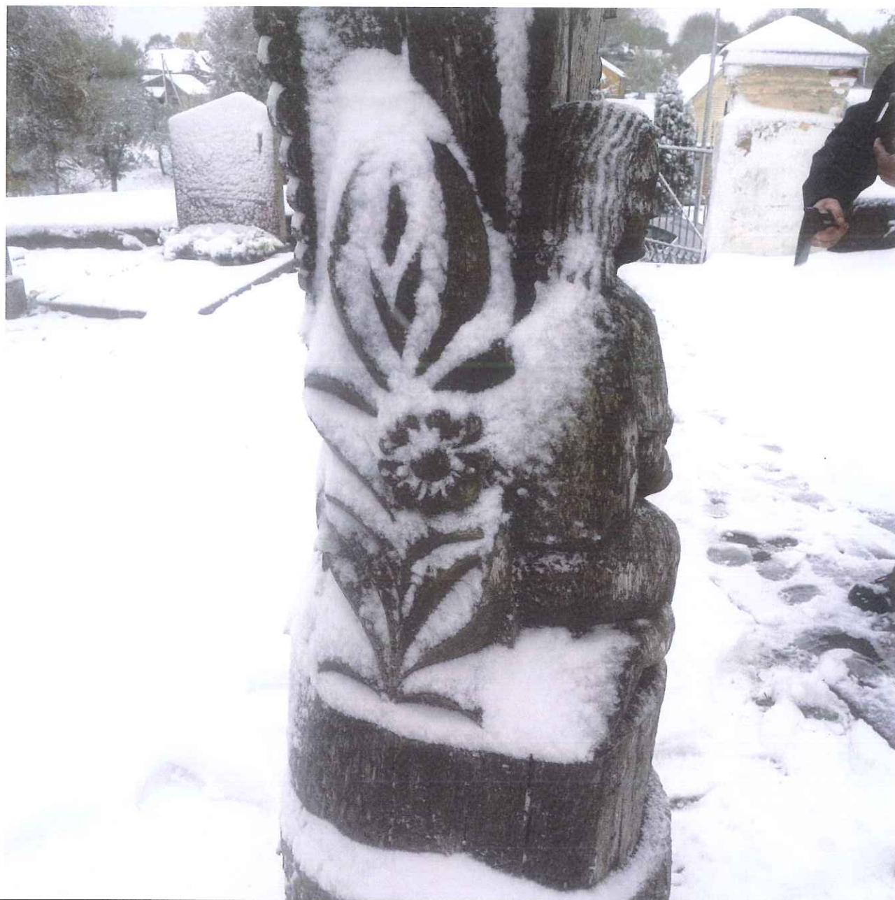
Unikalus kodas Kultūros vertybių registre – 2640