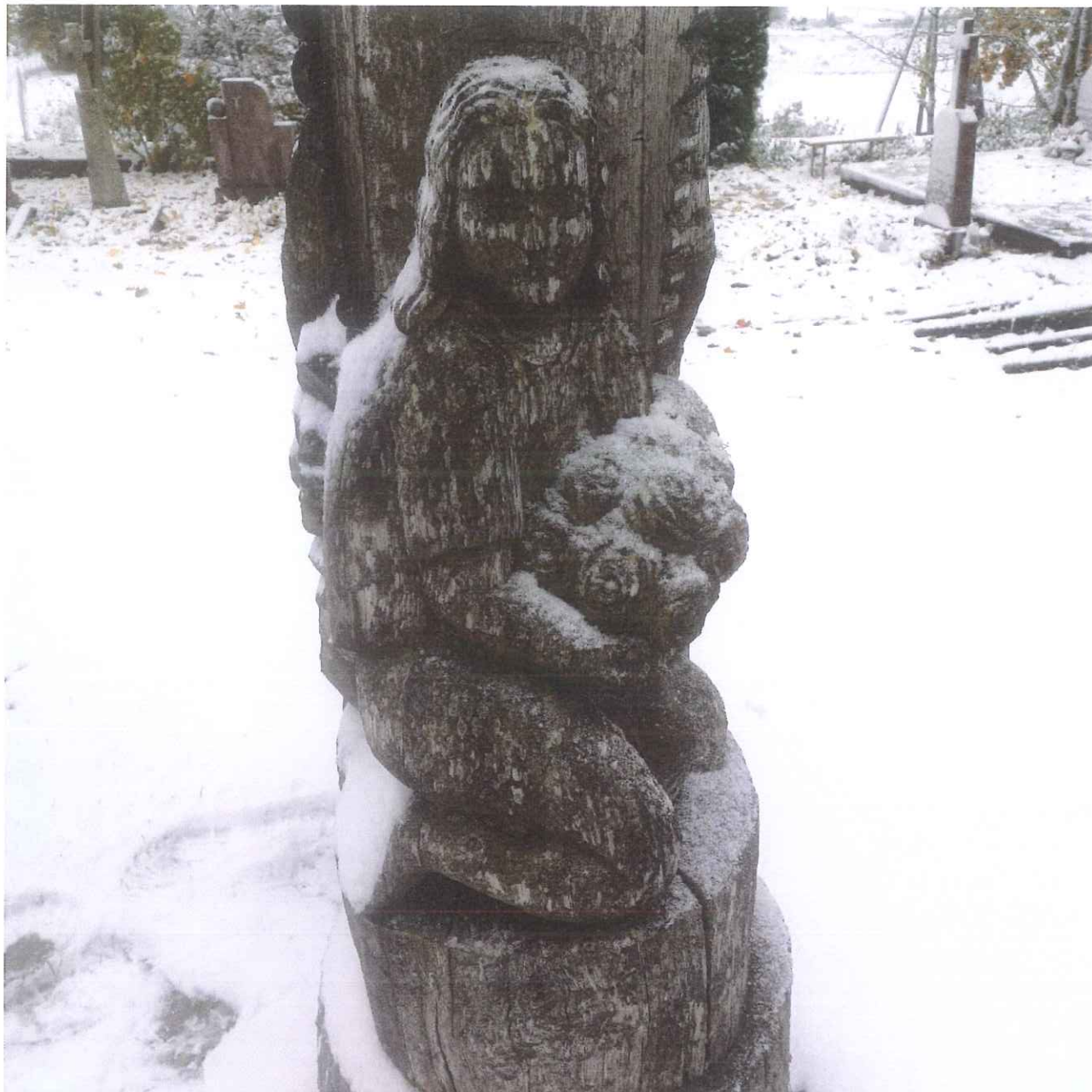
Unikalus kodas Kultūros vertybių registre – 2640