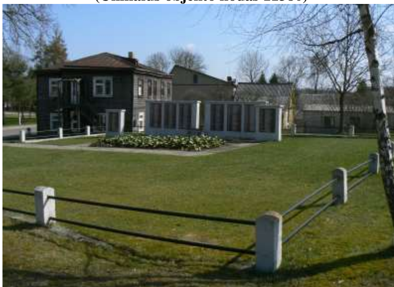
(Unikalus objekto kodas 11380)