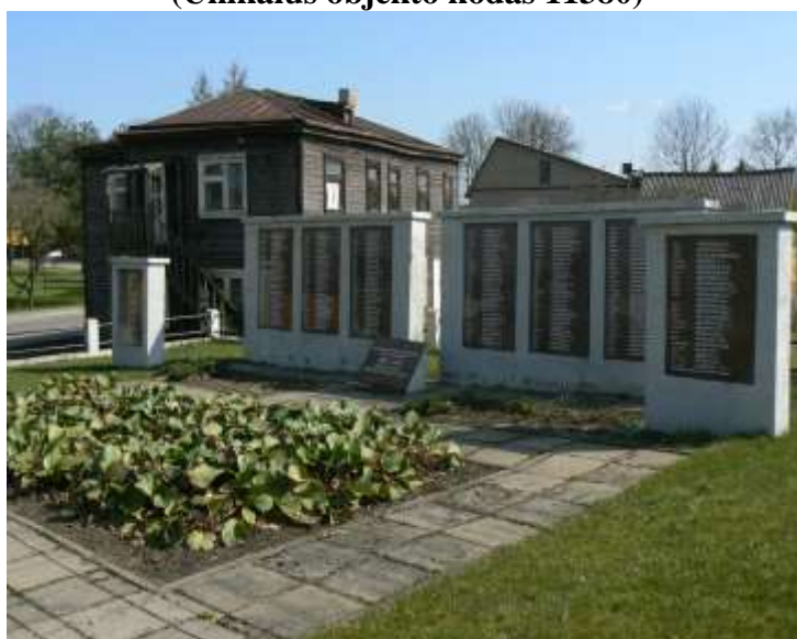
(Unikalus objekto kodas 11380)