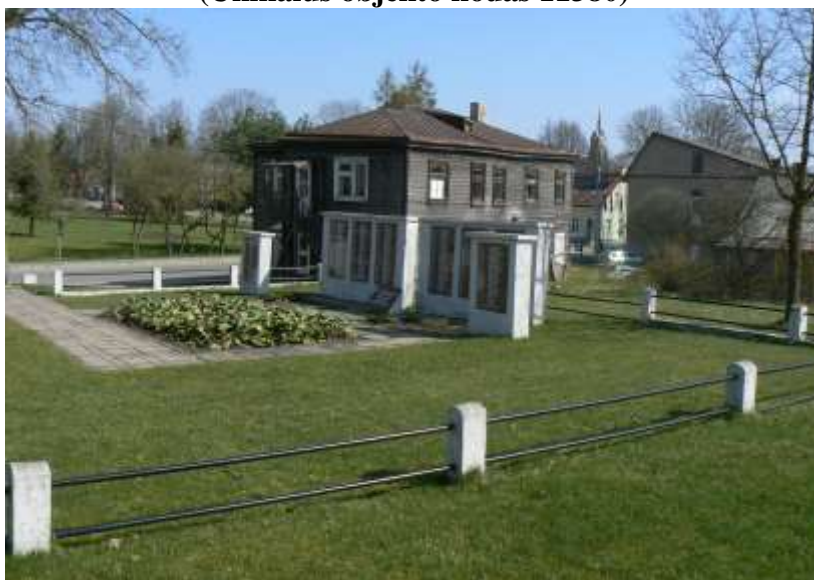
(Unikalus objekto kodas 11380)