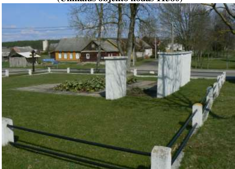
(Unikalus objekto kodas 11380)