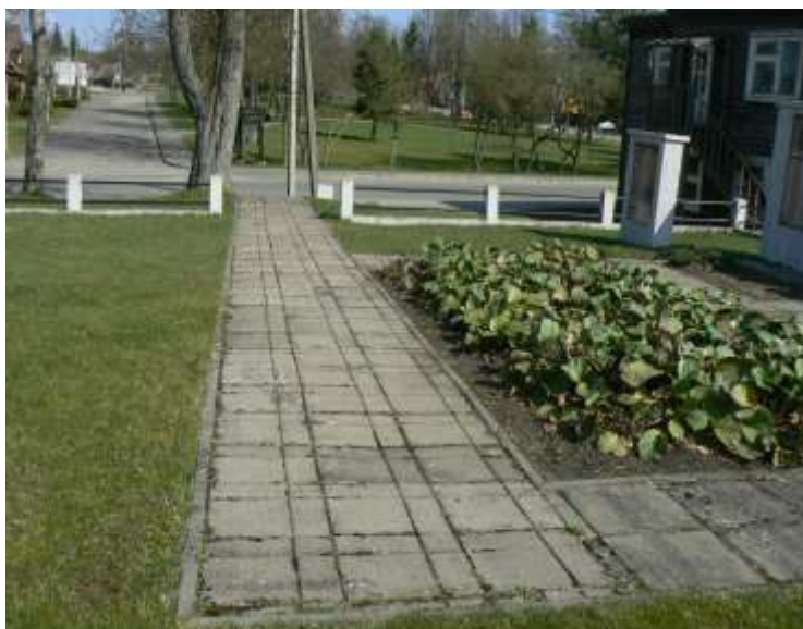
(Unikalus objekto kodas 11380)