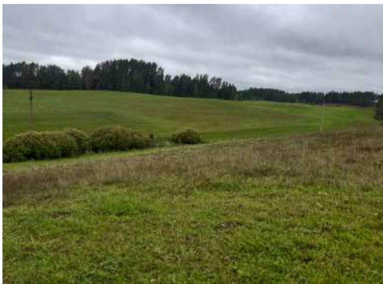
(Unikalus objekto kodas 27112)