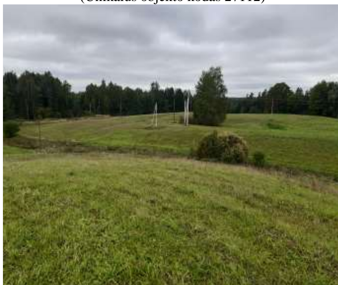
(Unikalus objekto kodas 27112)