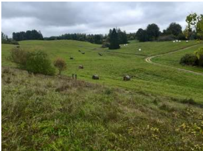
(Unikalus objekto kodas 27112)