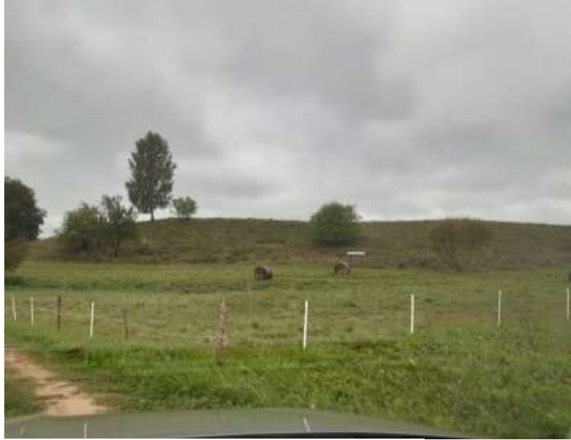
(Unikalus objekto kodas 27112)