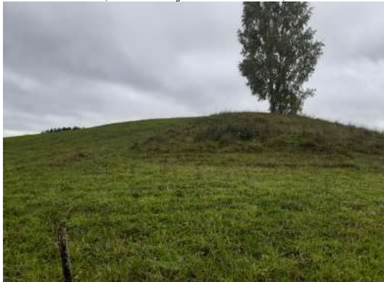
(Unikalus objekto kodas 27112)