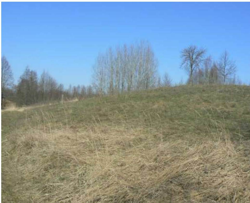
(unikalus objekto kodas 7219)