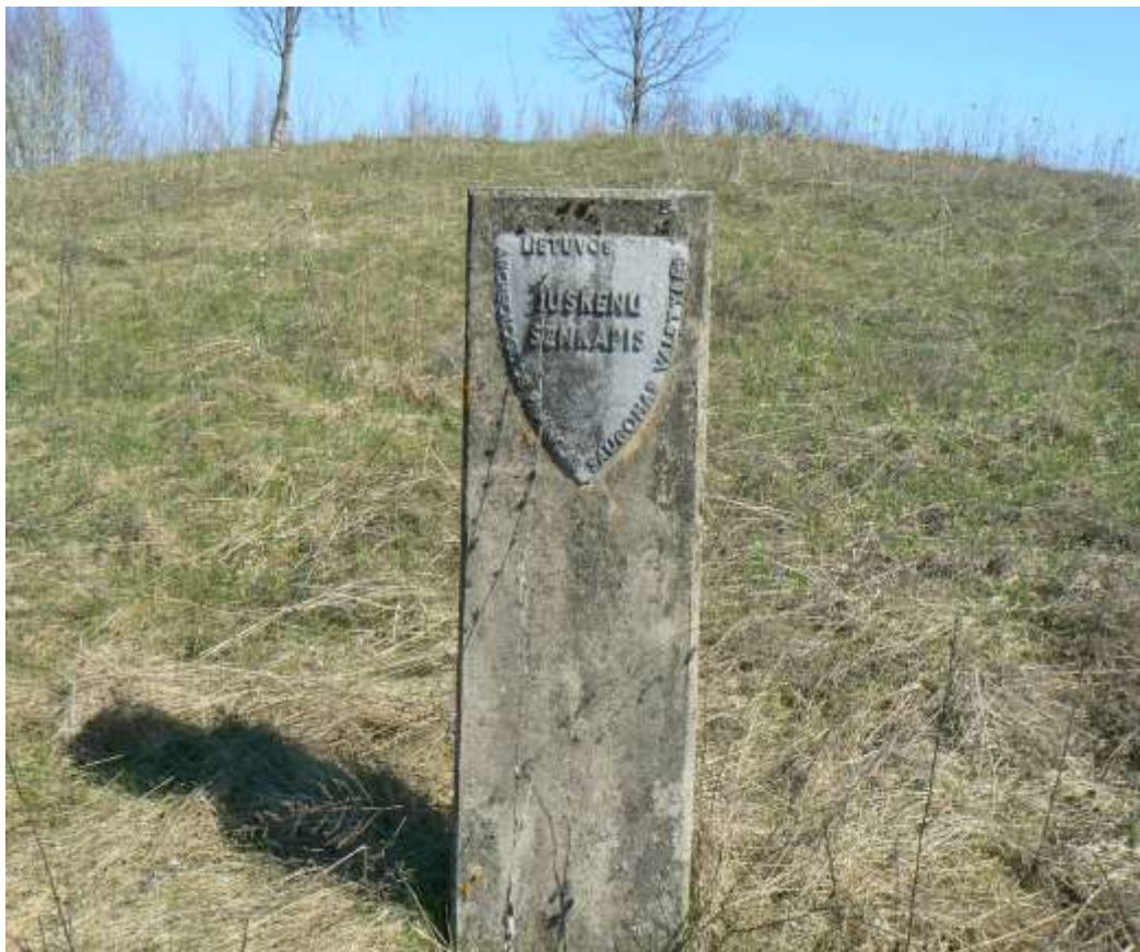
(unikalus objekto kodas 7219)