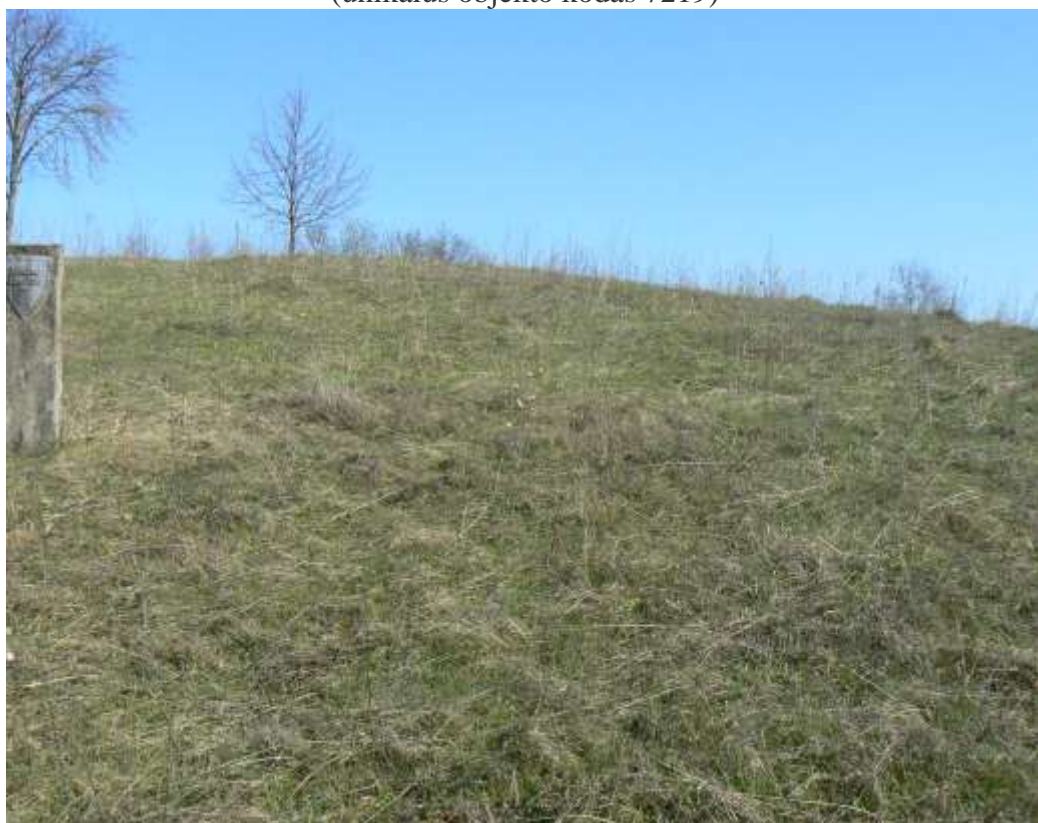
(unikalus objekto kodas 7219)