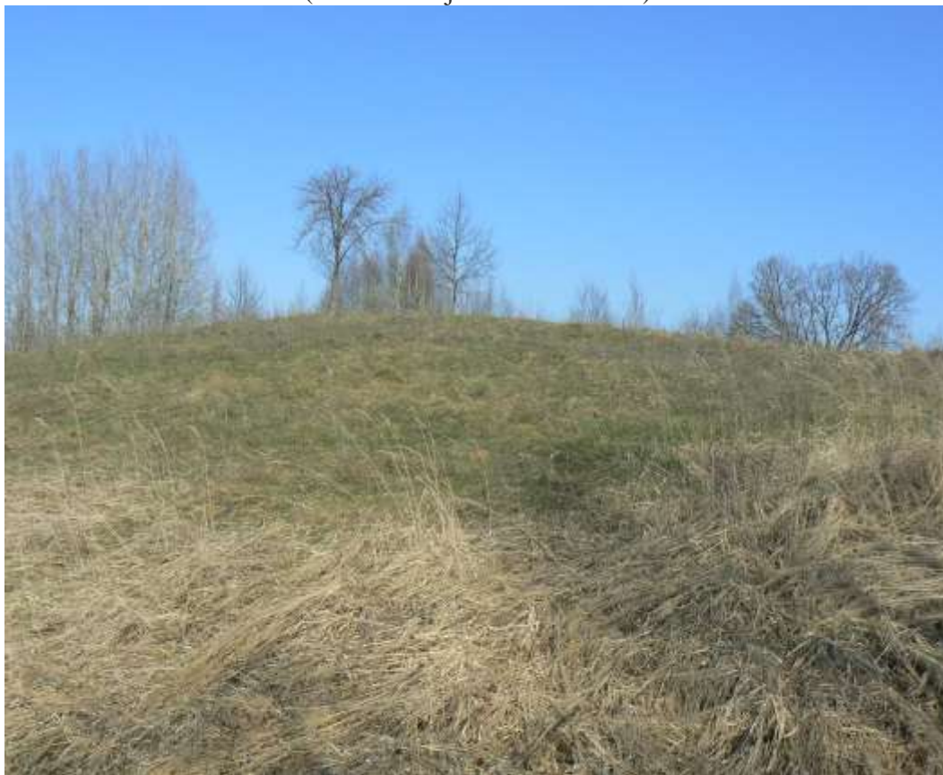
(unikalus objekto kodas 7219)