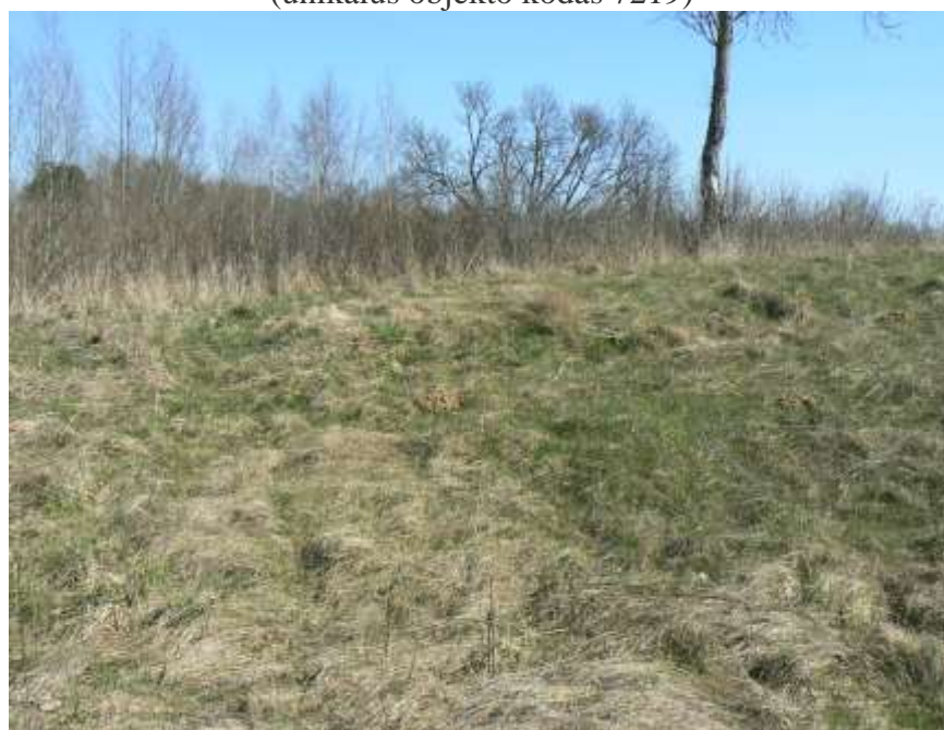
(unikalus objekto kodas 7219)