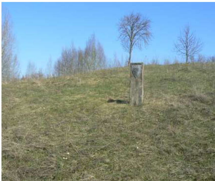
(unikalus objekto kodas 7219)