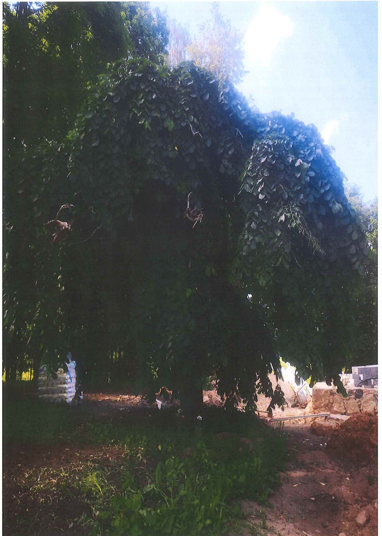
Unikalus kodas Kultūros vertybių registre – 42859