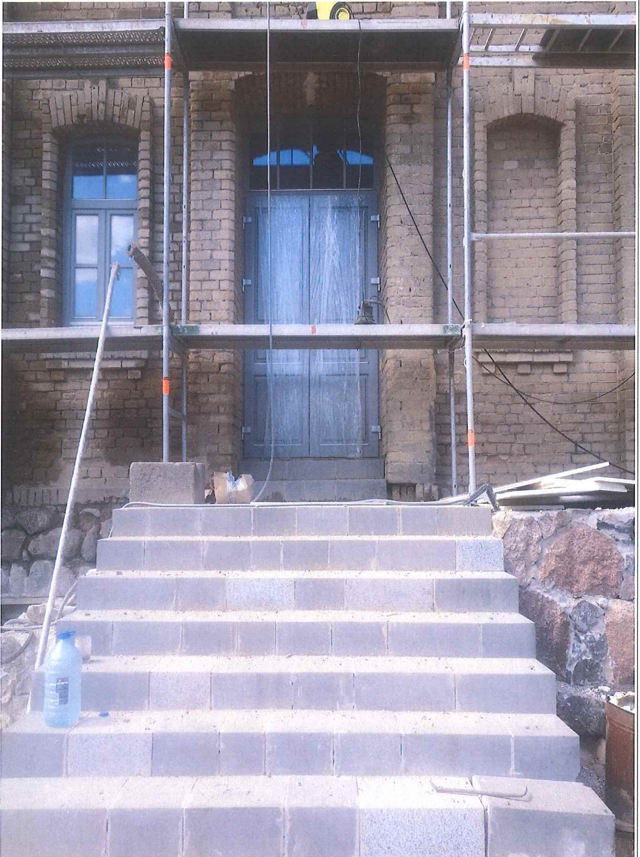
Unikalus kodas Kultūros vertybių registre – 42859