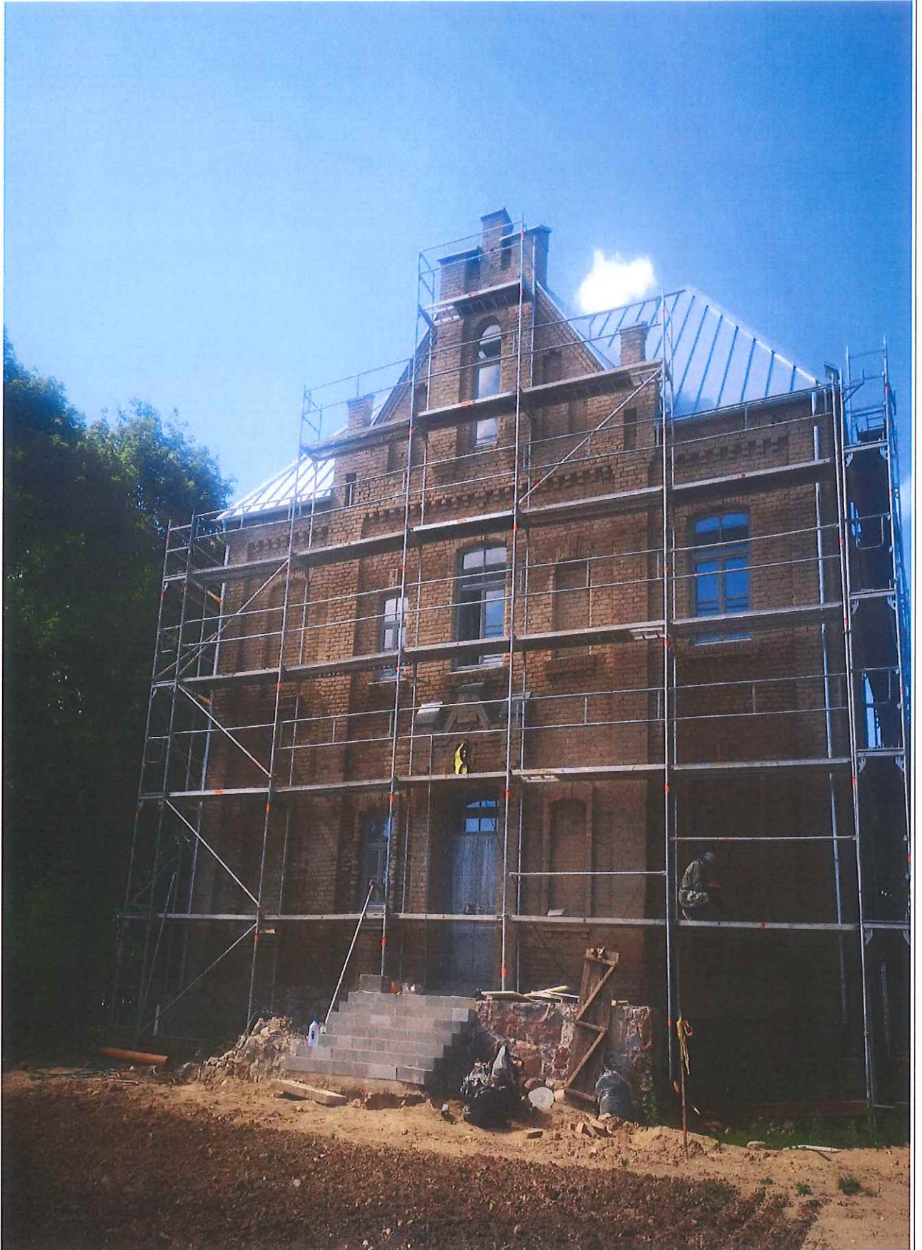
Unikalus kodas Kultūros vertybių registre – 42859