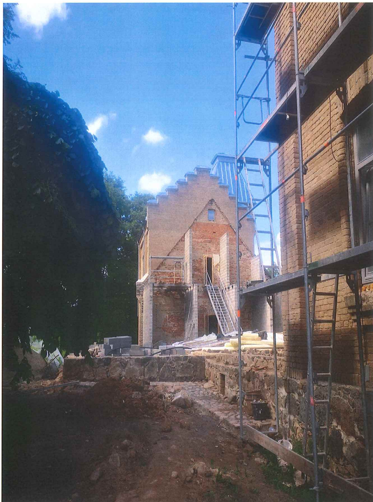
Unikalus kodas Kultūros vertybių registre – 42859