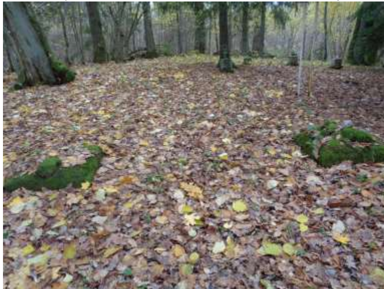
(unikalus objekto kodas 21263)