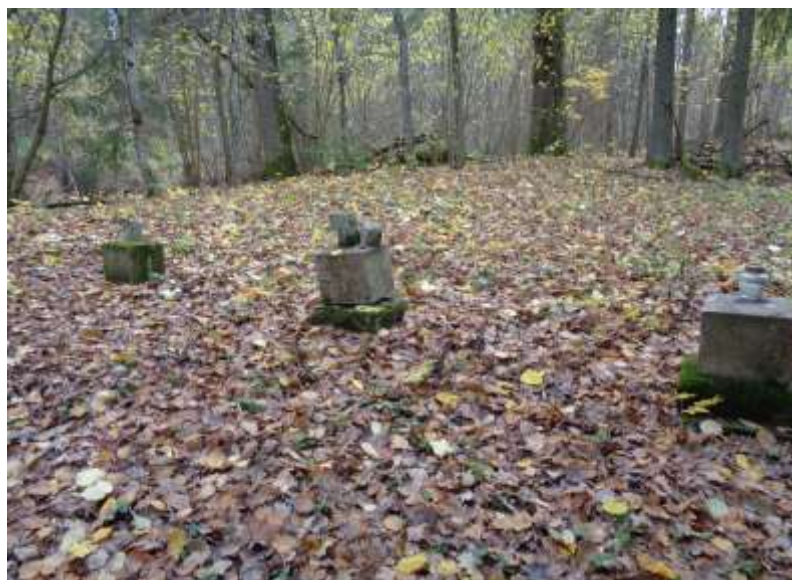
(unikalus objekto kodas 21263)