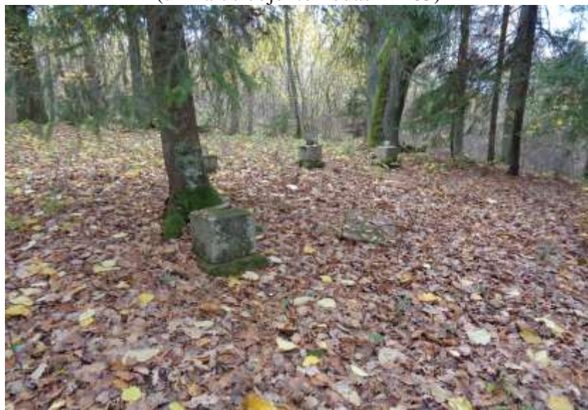
(unikalus objekto kodas 21263)