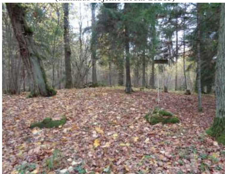
(unikalus objekto kodas 21263)