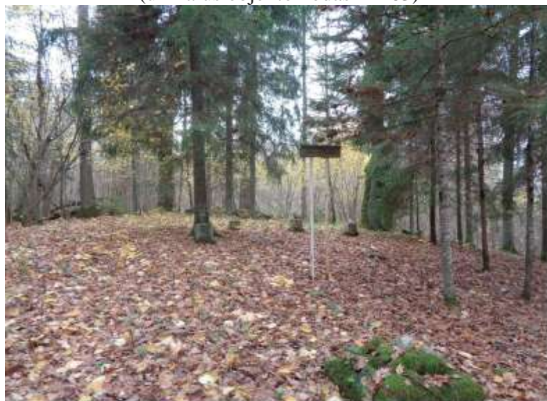
(unikalus objekto kodas 21263)