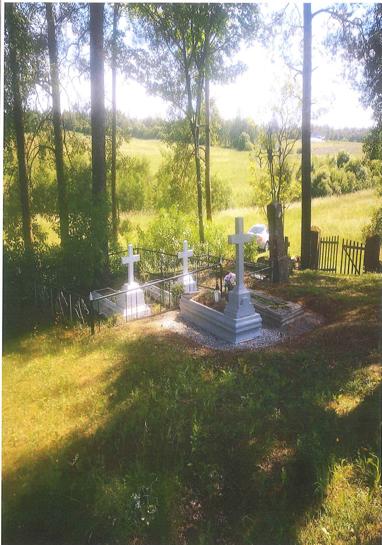
Unikalus kodas Kultūros vertybių registre – 21296