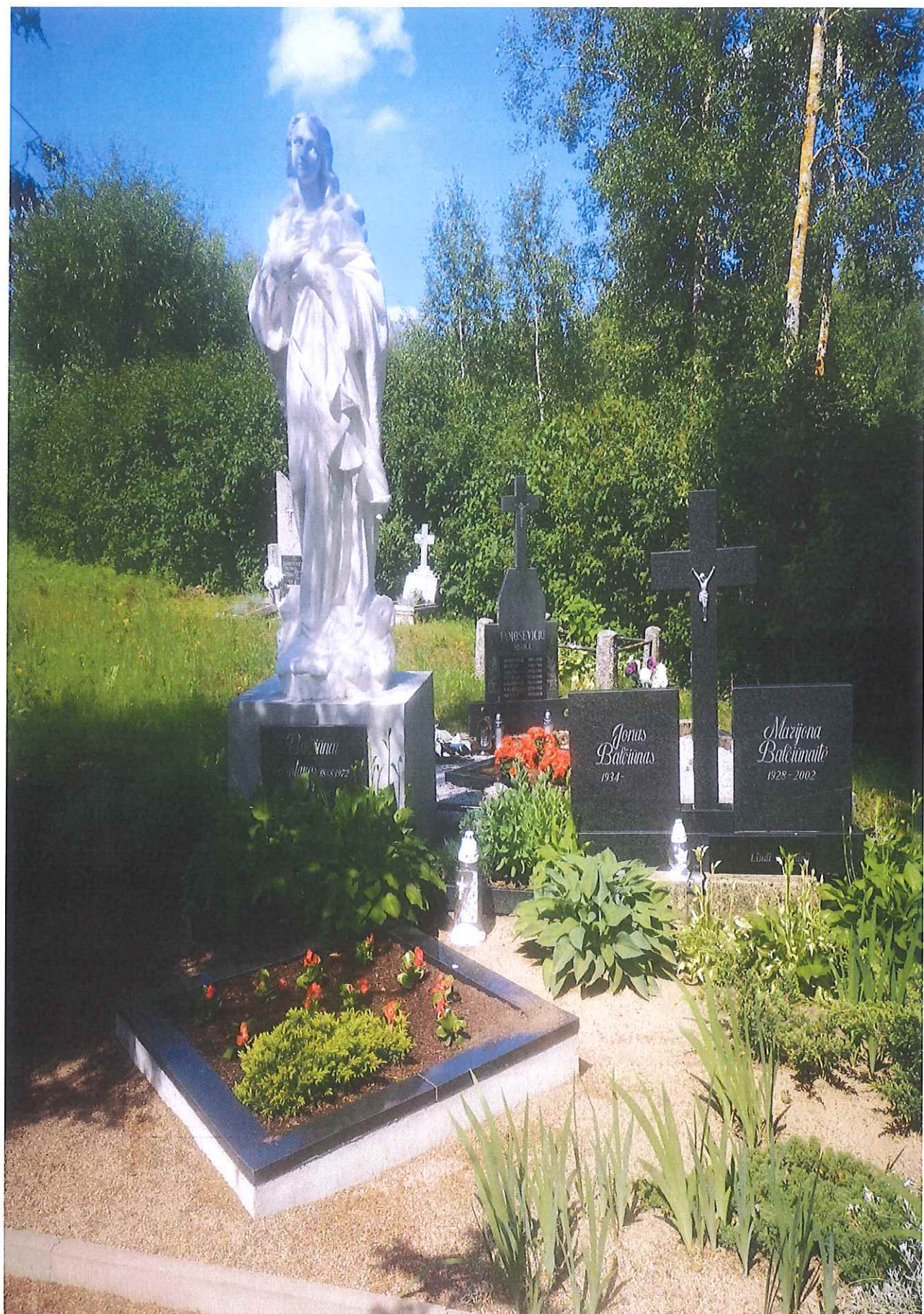
Unikalus kodas Kultūros vertybių registre – 21296