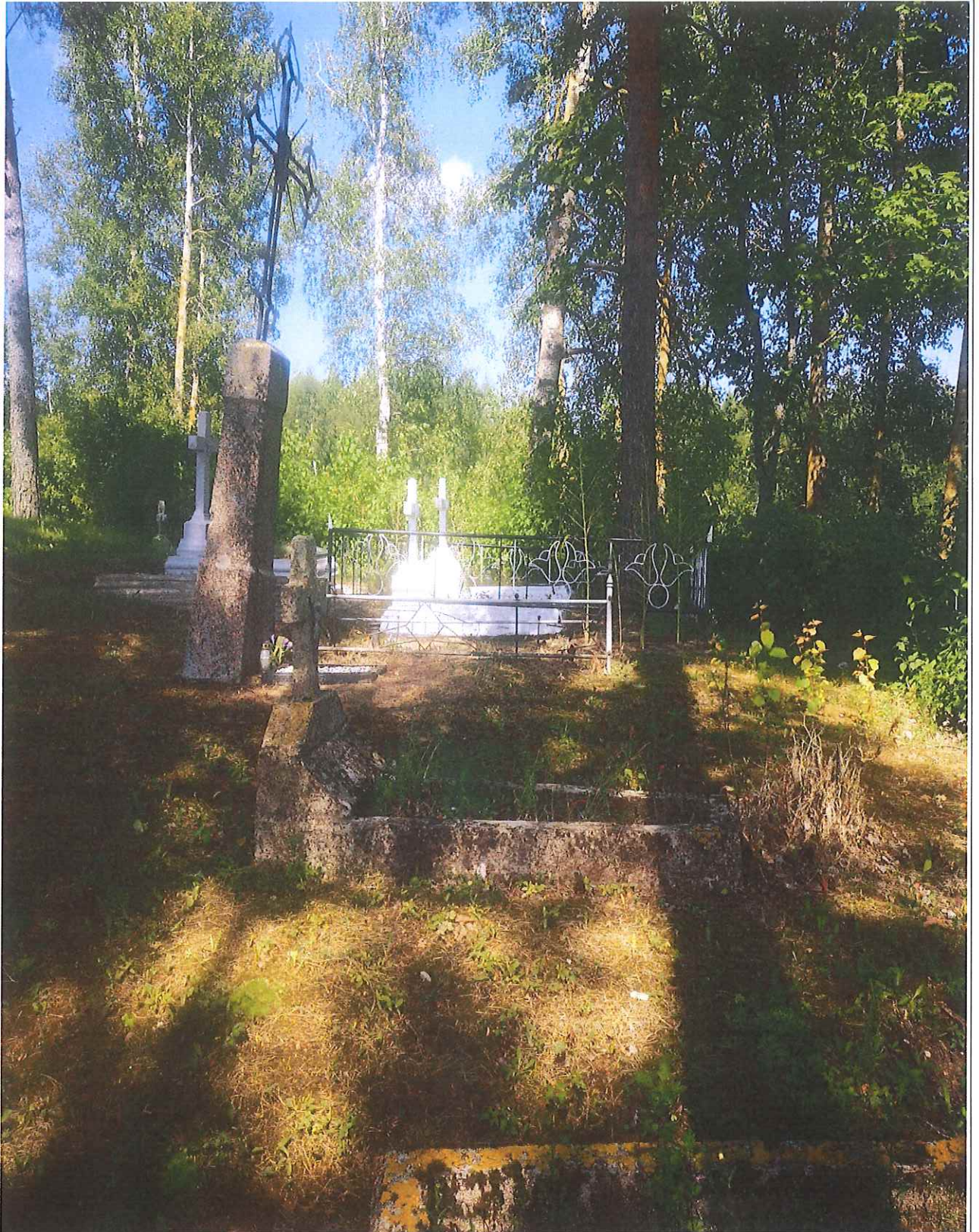
Unikalus kodas Kultūros vertybių registre – 21296