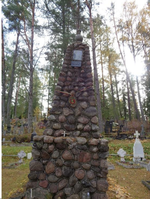
Unikalus kodas Kultūros vertybių registre – 17066