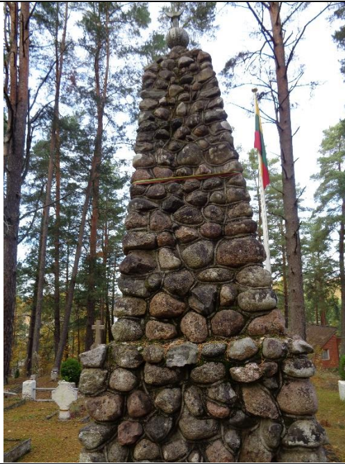
Unikalus kodas Kultūros vertybių registre – 17066