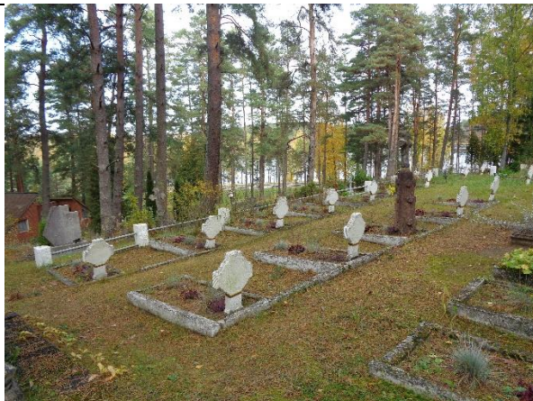
Unikalus kodas Kultūros vertybių registre – 17066