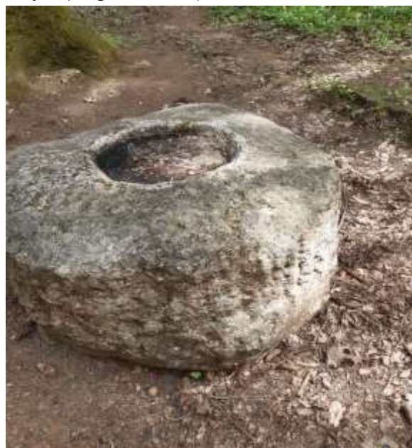
(unikalus objekto kods Kultūros vērtību reģistrē 5687)