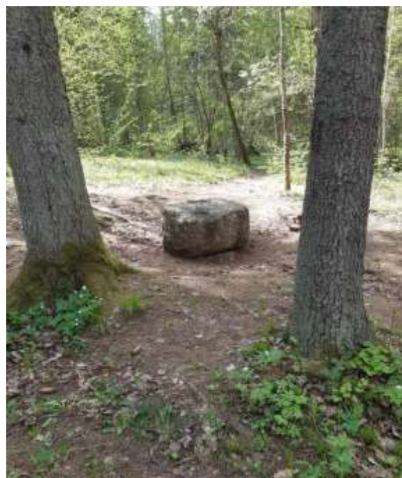
(unikalus objekto kods Kultūros vērtību reģistrē 5687)