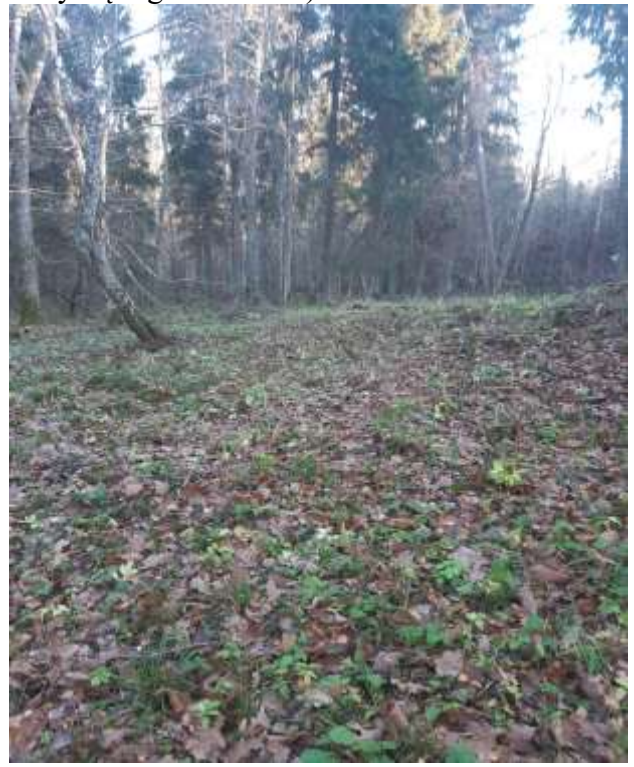
(unikalus kodas Kultūros vertybių registre 16328)