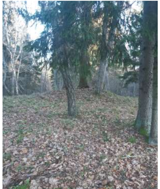
(unikalus kodas Kultūros vertybių registre 16328)