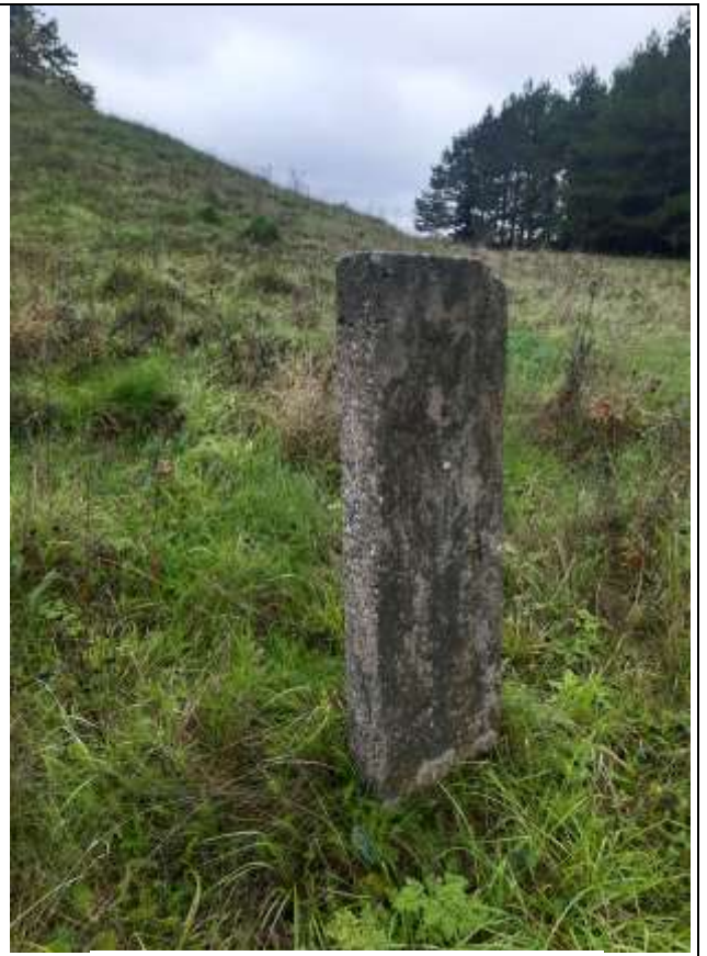
(Unikalus objekto kodas 5713, 24108)