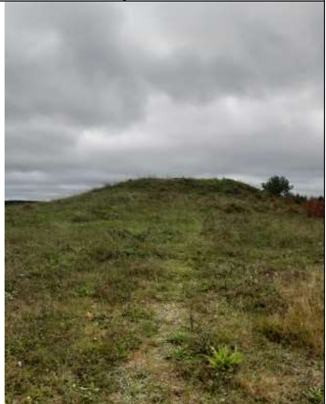
(Unikalus objekto kodas 5713, 24108)