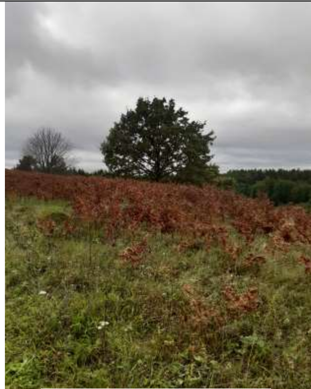
(Unikalus objekto kodas 5713, 24108)