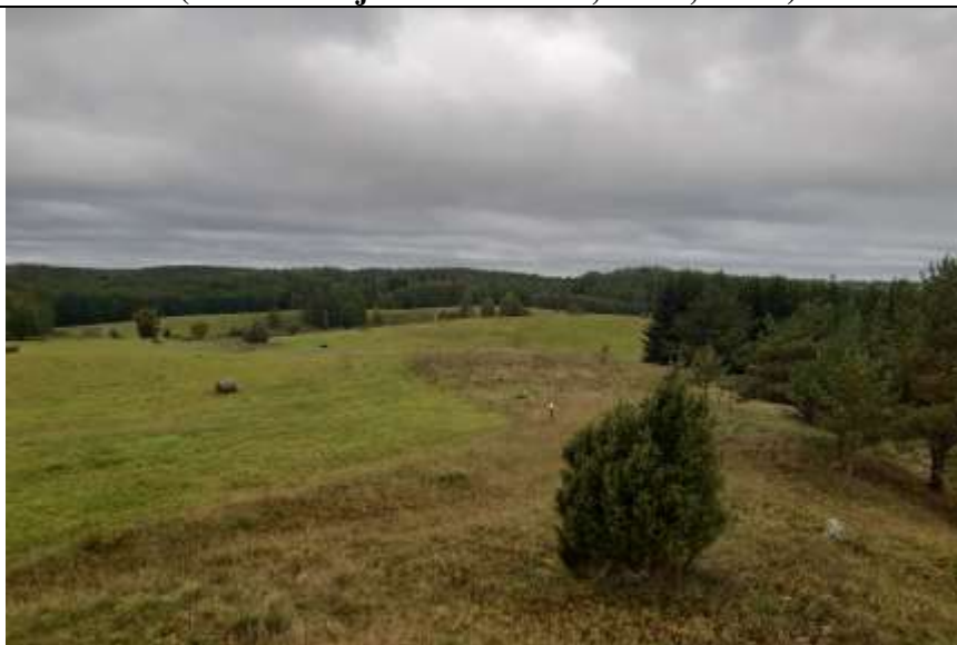
(Unikalus objekto kodas 5713, 24108, 24109)