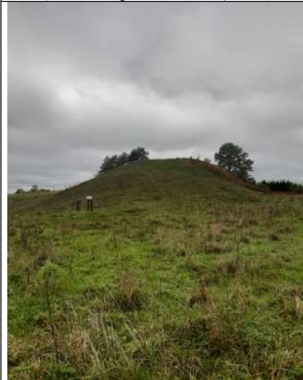
(Unikalus objekto kodas 5713, 24108)