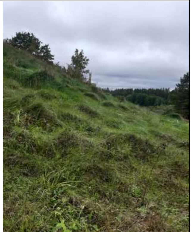
(Unikalus objekto kodas 5713, 24108)