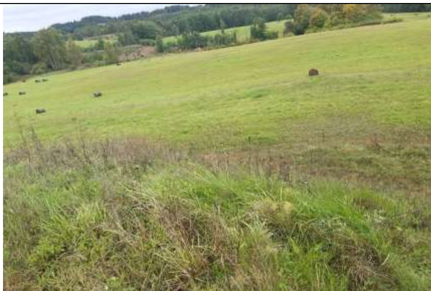
(Unikalus objekto kodas 5713, 24108, 24109)