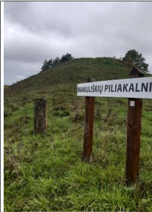
(Unikalus objekto kodas 5713, 24108)