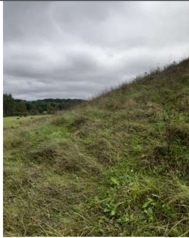
(Unikalus objekto kodas 5713, 24108)