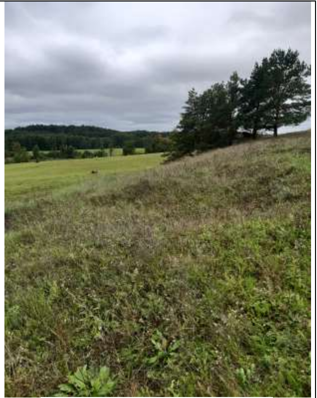
(Unikalus objekto kodas 5713, 24108)