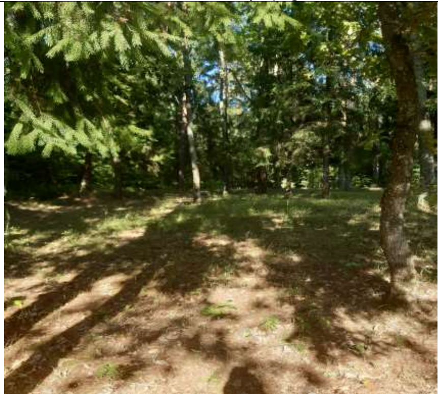
unikalus kodas Kultūros vertybių registre 21251