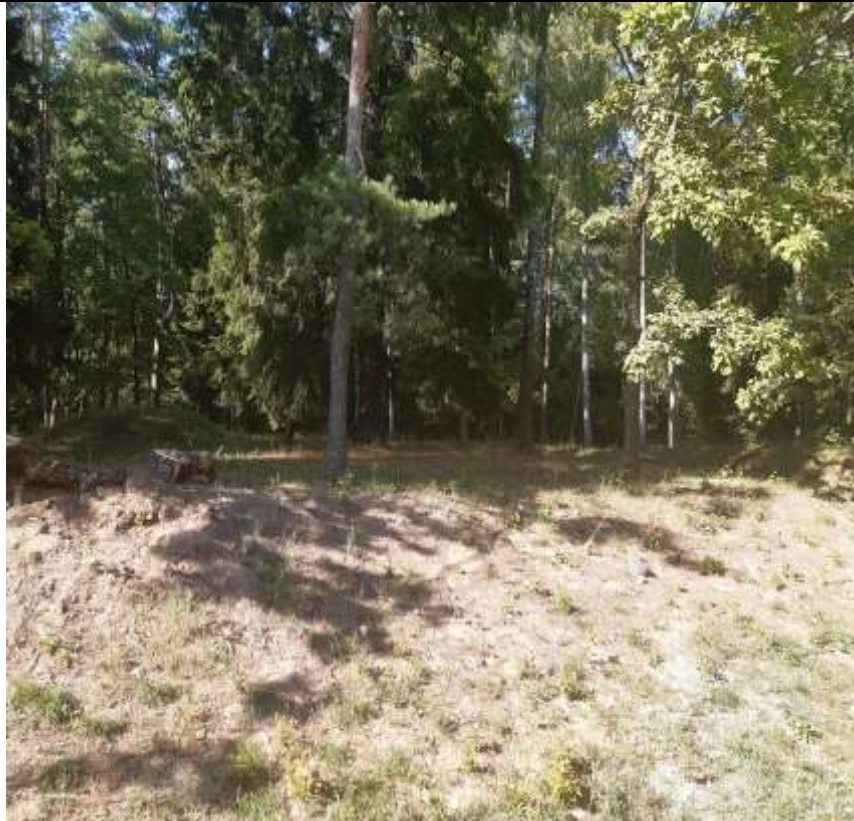
unikalus kodas Kultūros vertybių registre 21251