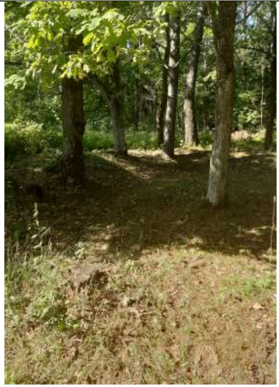
unikalus kodas Kultūros vertybių registre 21251