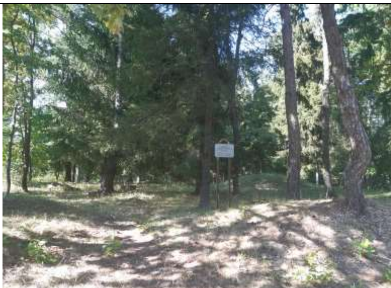
unikalus kodas Kultūros vertybių registre 21251