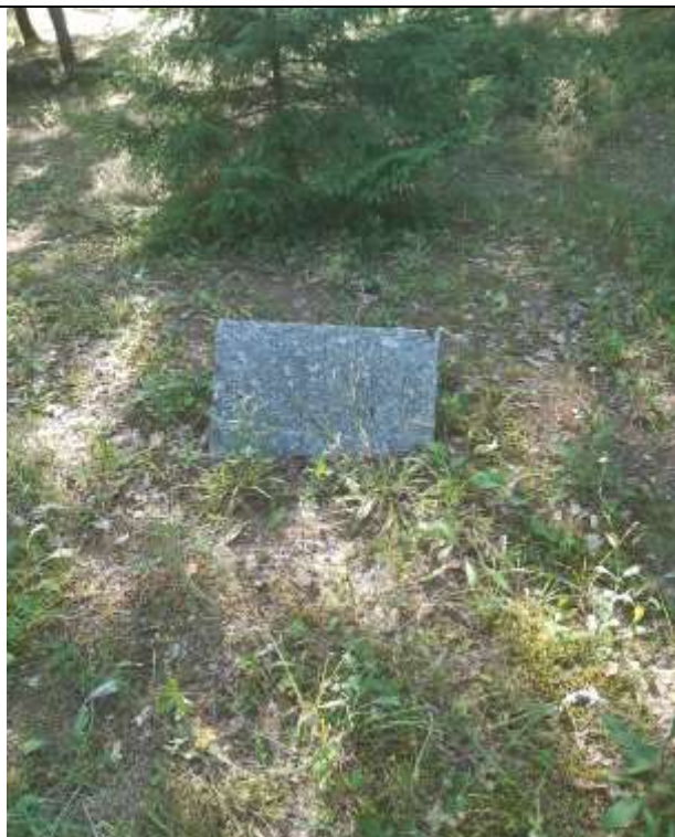
unikalus kodas Kultūros vertybių registre 21251