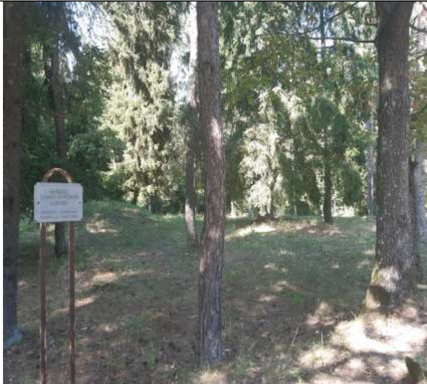
unikalus kodas Kultūros vertybių registre 21251