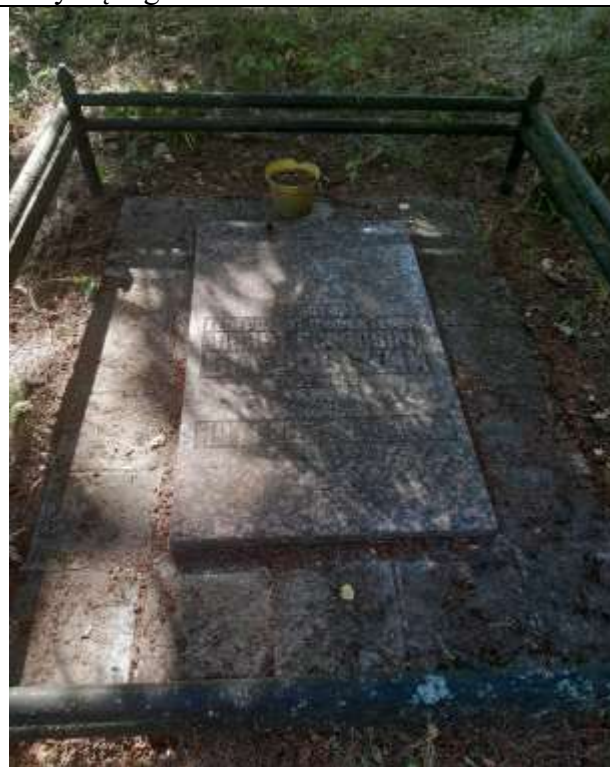
unikalus kodas Kultūros vertybių registre 21251