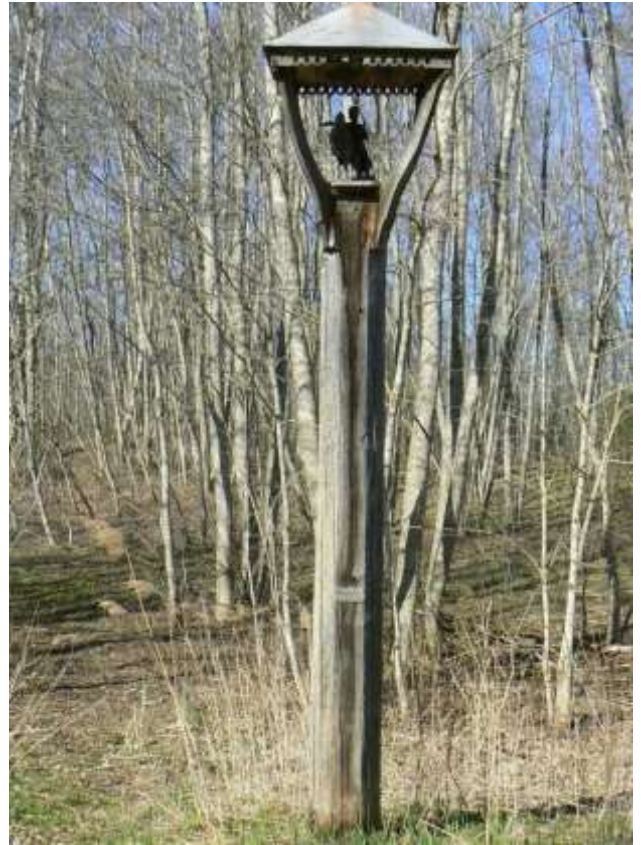
(unikalus objekto kodas 15406)