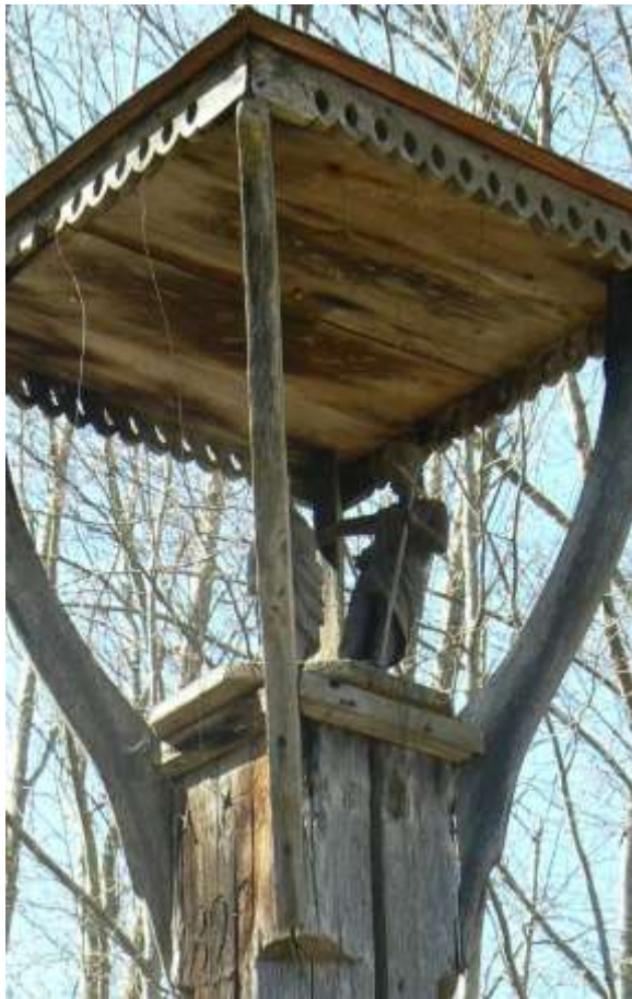
(unikalus objekto kodas 15406)