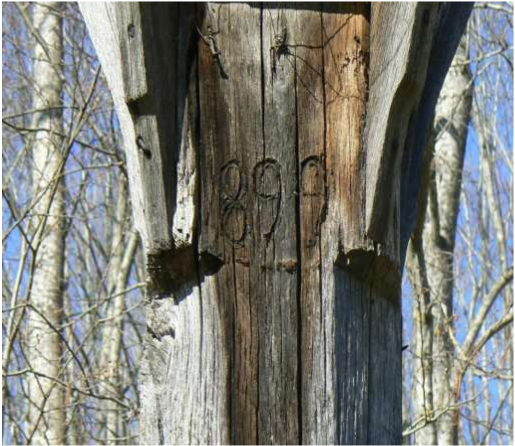
(unikalus objekto kodas 15406)