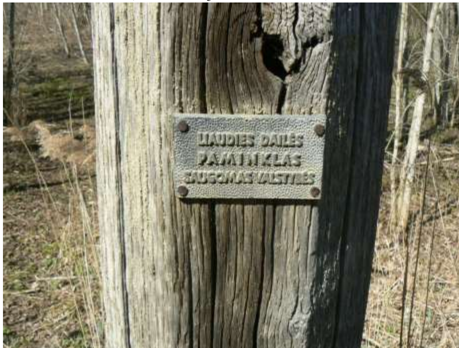
(unikalus objekto kodas 15406)