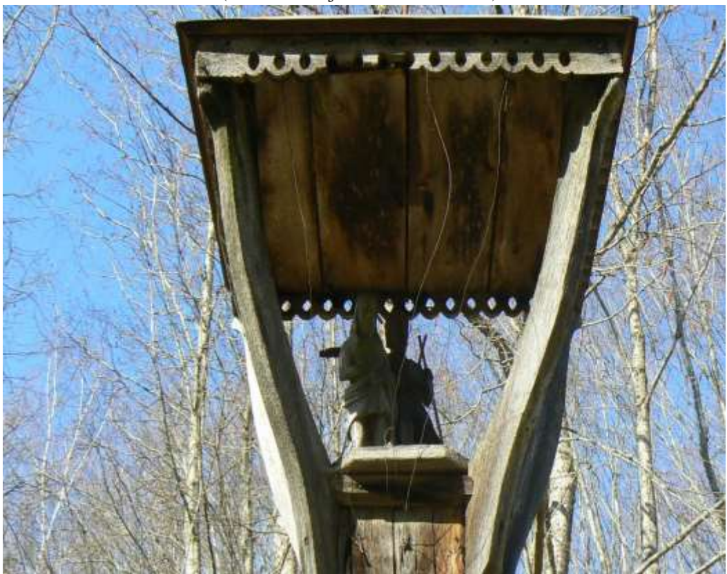
(unikalus objekto kodas 15406)