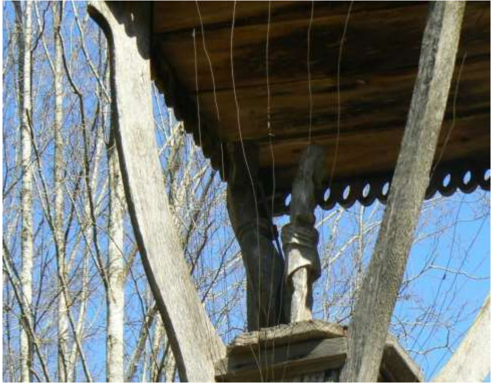
(unikalus objekto kodas 15406)