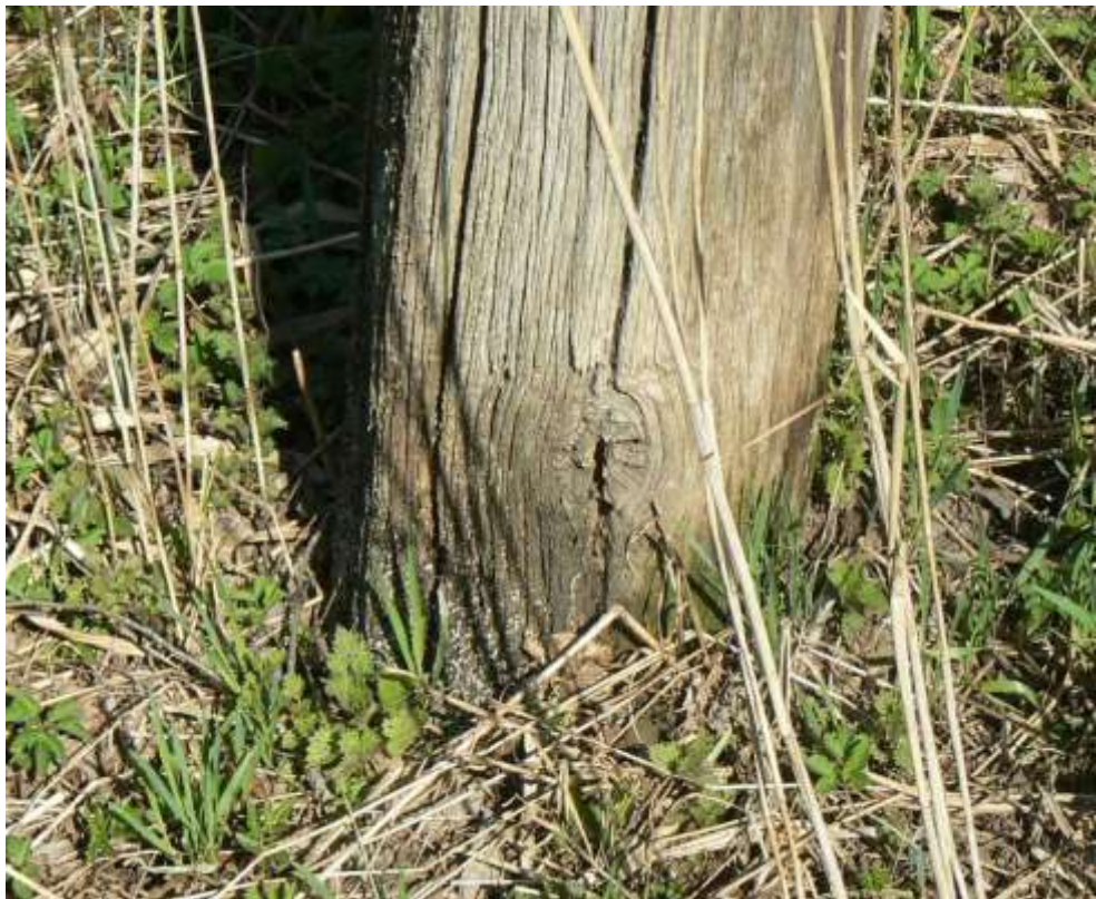
(unikalus objekto kodas 15406)