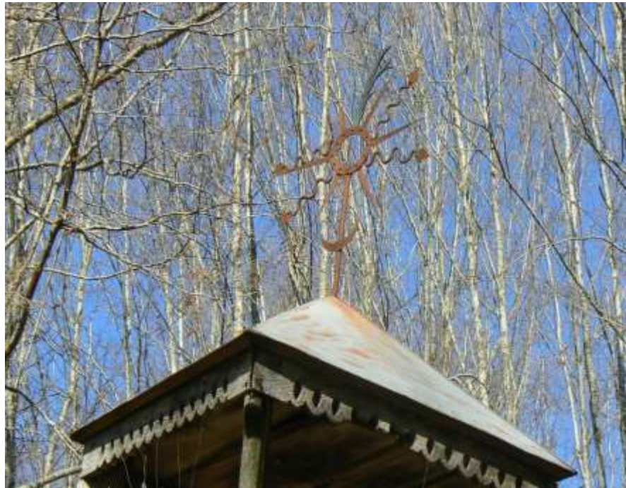
(unikalus objekto kodas 15406)