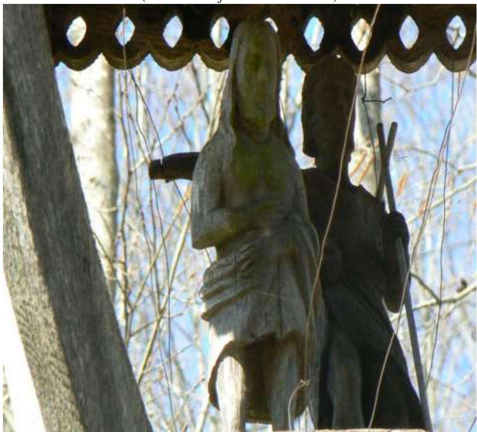
(unikalus objekto kodas 15406)