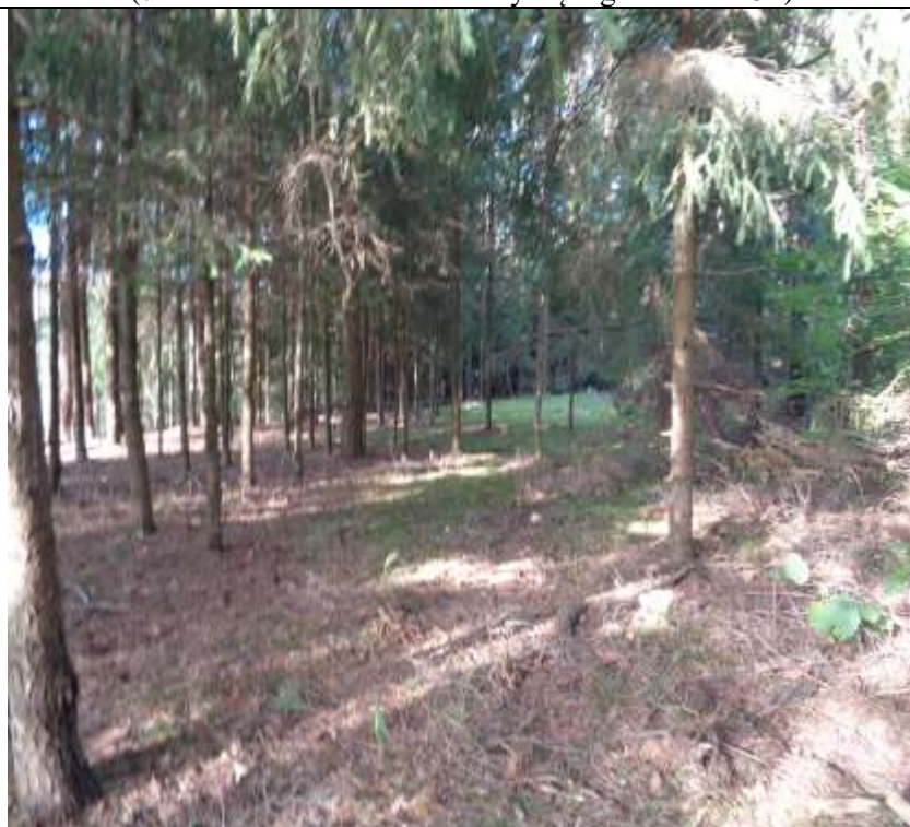
(unikalus kodas Kultūros vertybių registre – 21252)