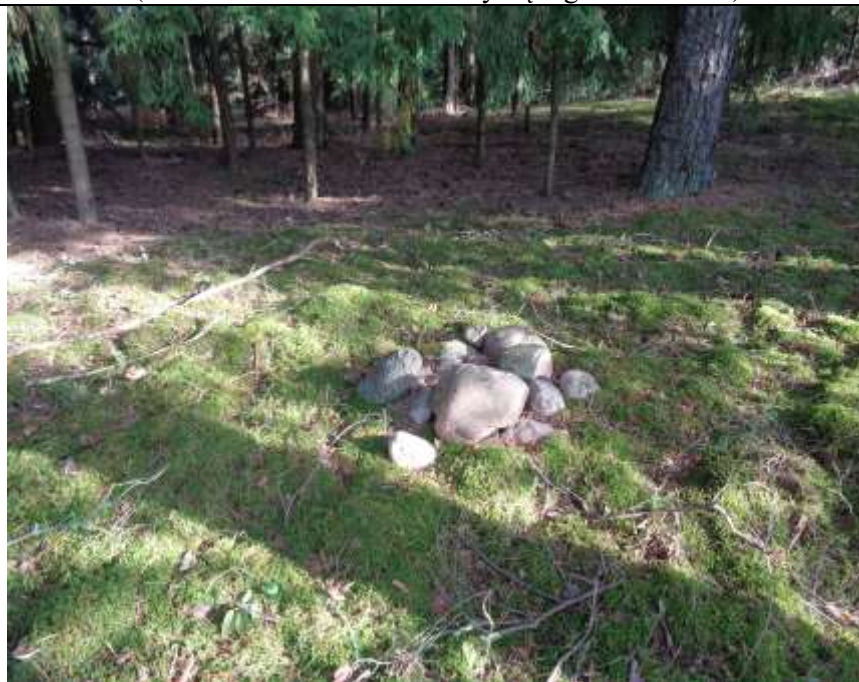
(unikalus kodas Kultūros vertybių registre – 21252)