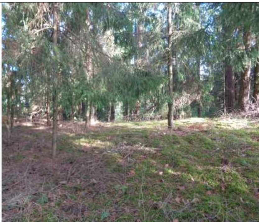
(unikalus kodas Kultūros vertybių registre – 21252)