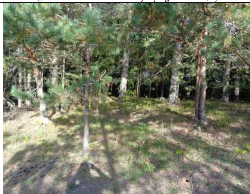
(unikalus kodas Kultūros vertybių registre – 21252)