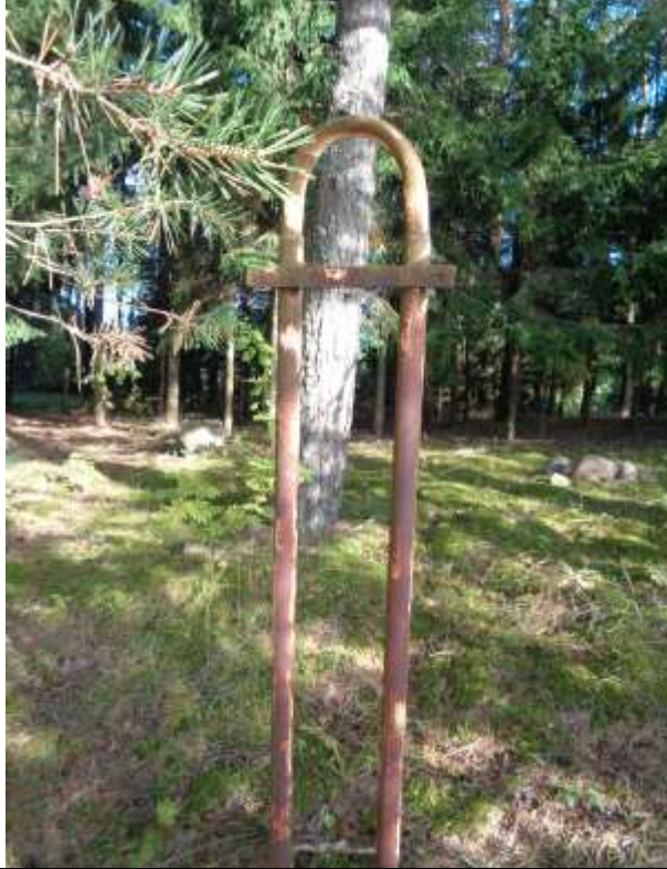
(unikalus kodas Kultūros vertybių registre – 21252)