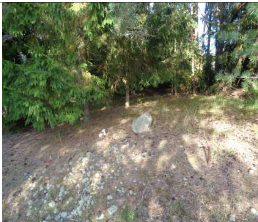
(unikalus kodas Kultūros vertybių registre – 21252)