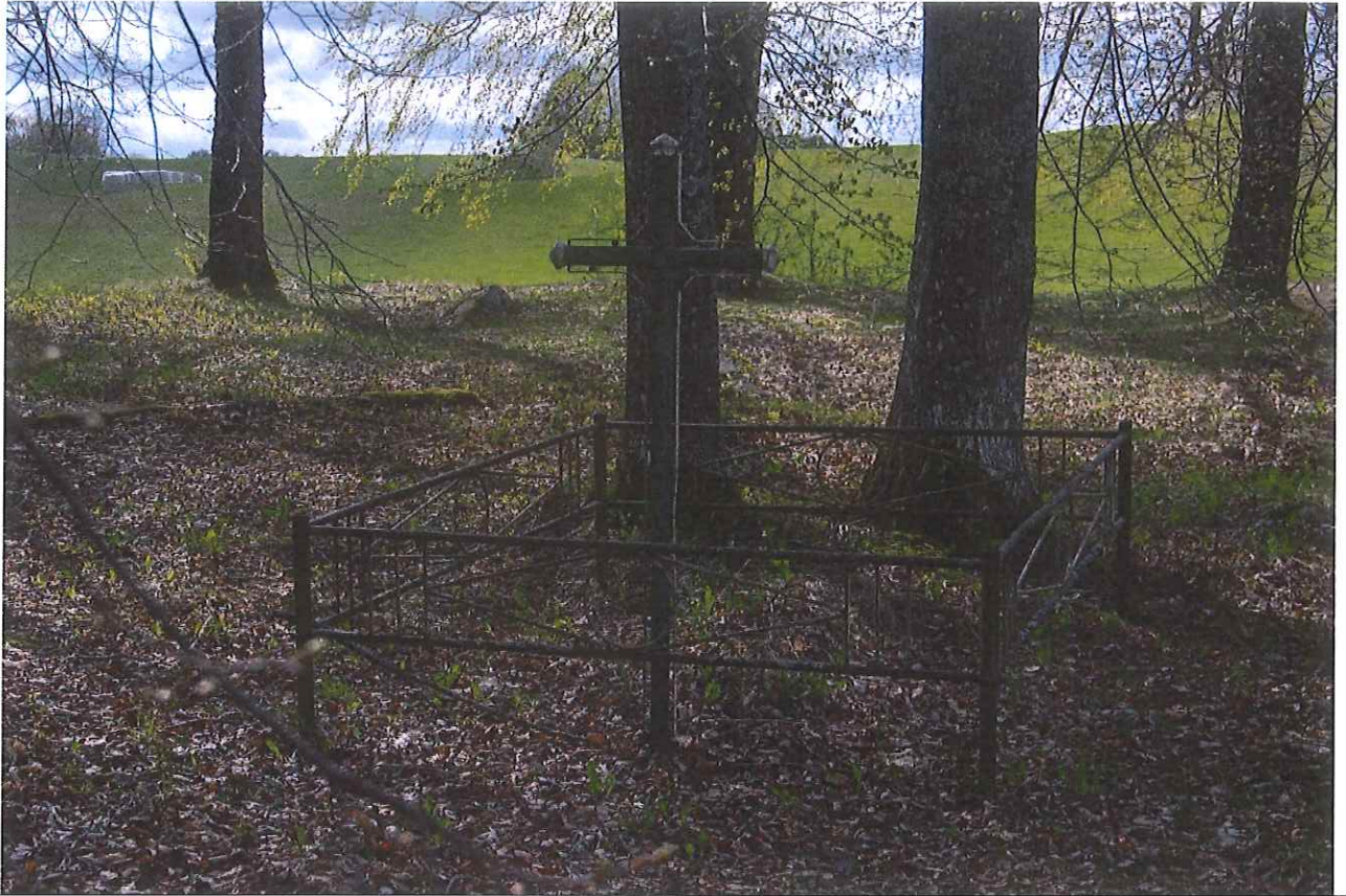
Unikalus kodas Kultūros vertybių registre – 21185