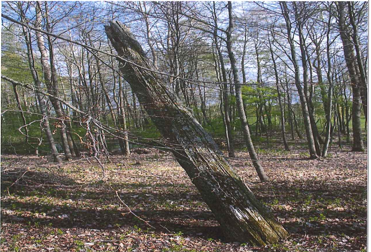
Unikalus kodas Kultūros vertybių registre – 21185