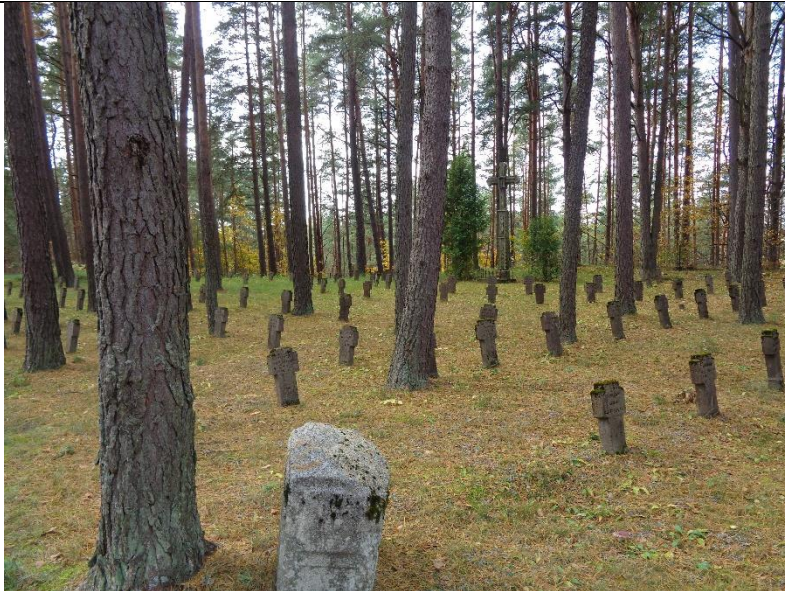
Unikalus kodas Kultūros vertybių registre – 38686