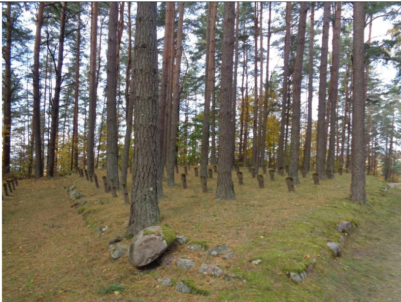
Unikalus kodas Kultūros vertybių registre – 38686