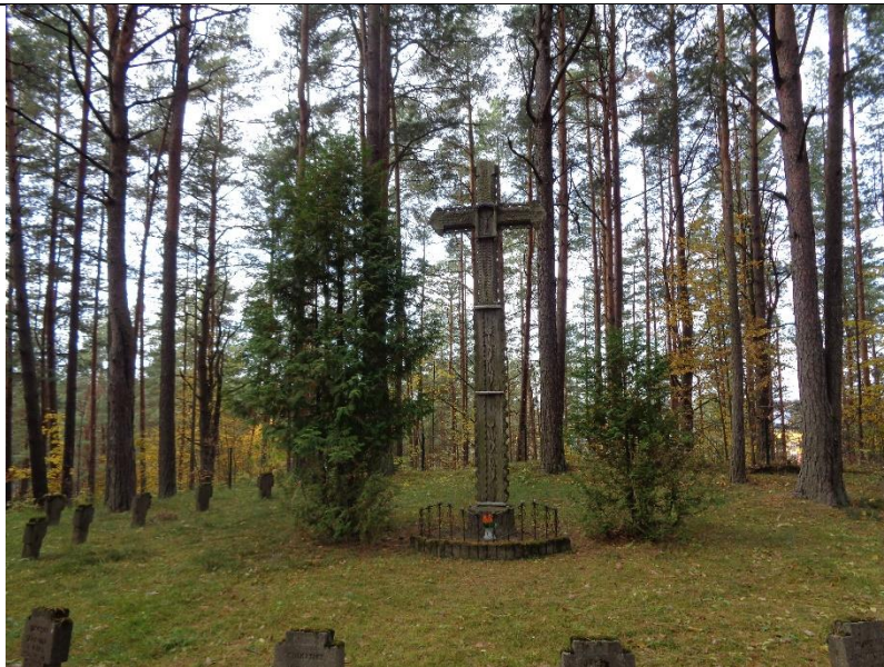
Unikalus kodas Kultūros vertybių registre – 38686