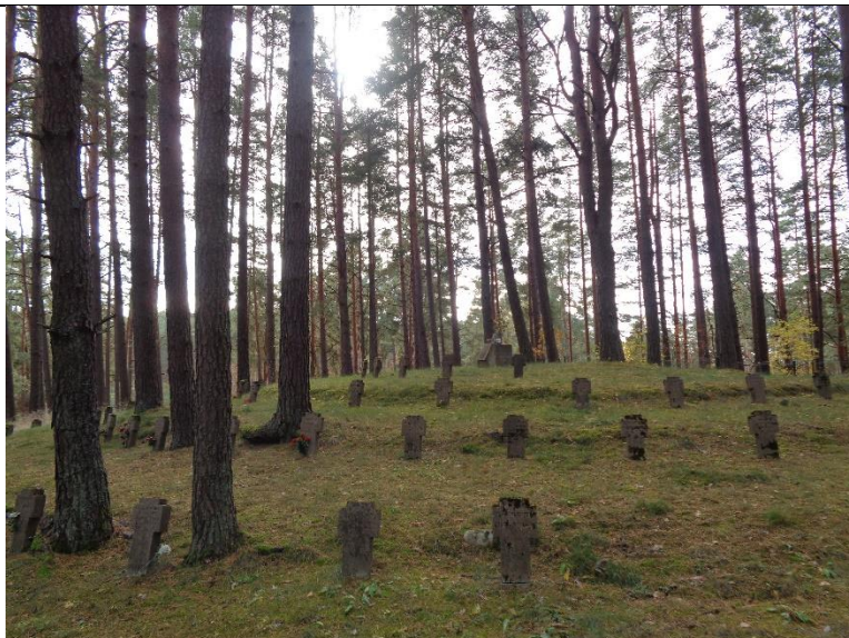
Unikalus kodas Kultūros vertybių registre – 38686