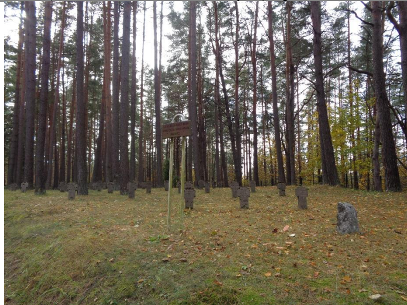
Unikalus kodas Kultūros vertybių registre – 38686