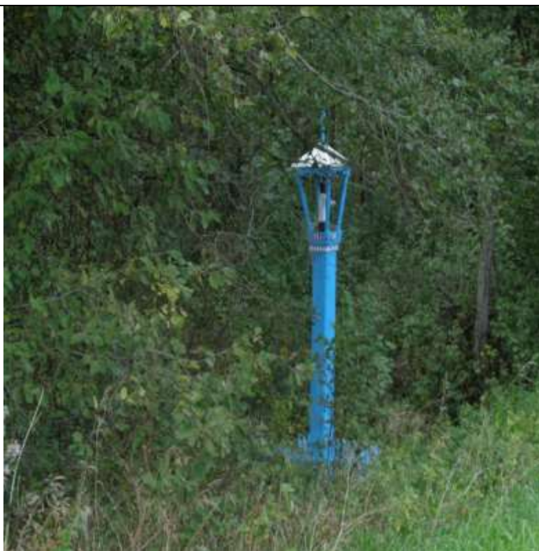
(Unikalus kodas Kultūros vertybių registre-14676)