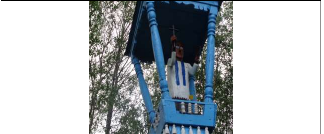
(Unikalus kodas Kultūros vertybių registre-14676)