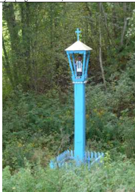
(Unikalus kodas Kultūros vertybių registre-14676)