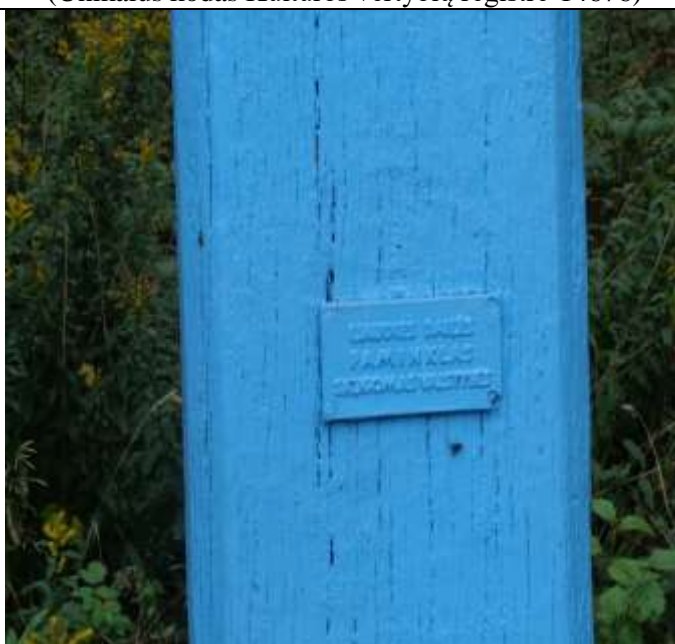
(Unikalus kodas Kultūros vertybių registre-14676)