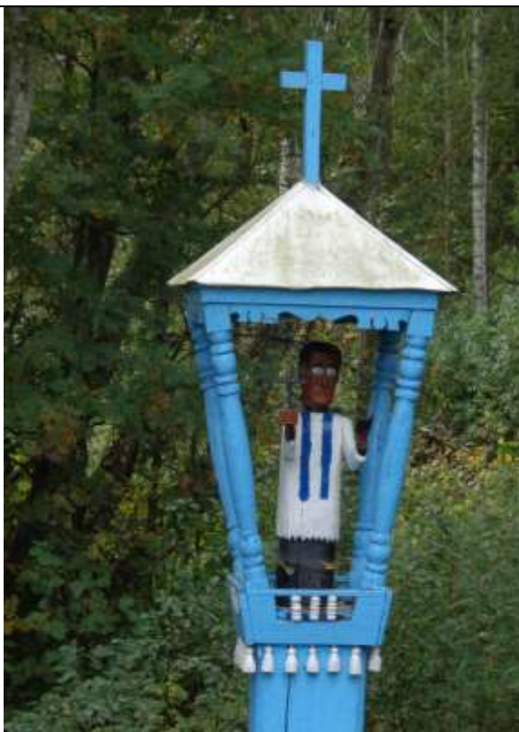
(Unikalus kodas Kultūros vertybių registre-14676)