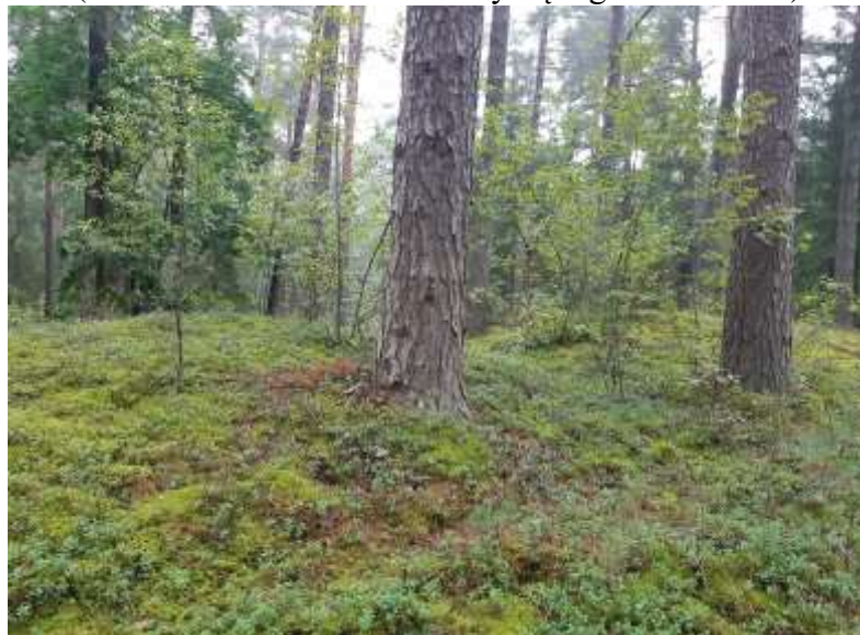
(unikalus kodas Kultūros vertybių registre – 13048)