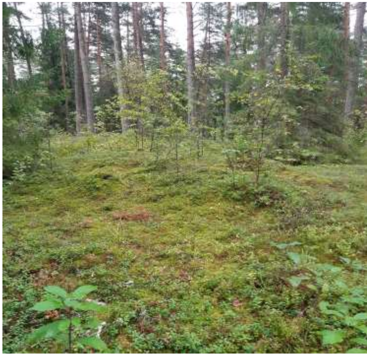
(unikalus kodas Kultūros vertybių registre – 13048)