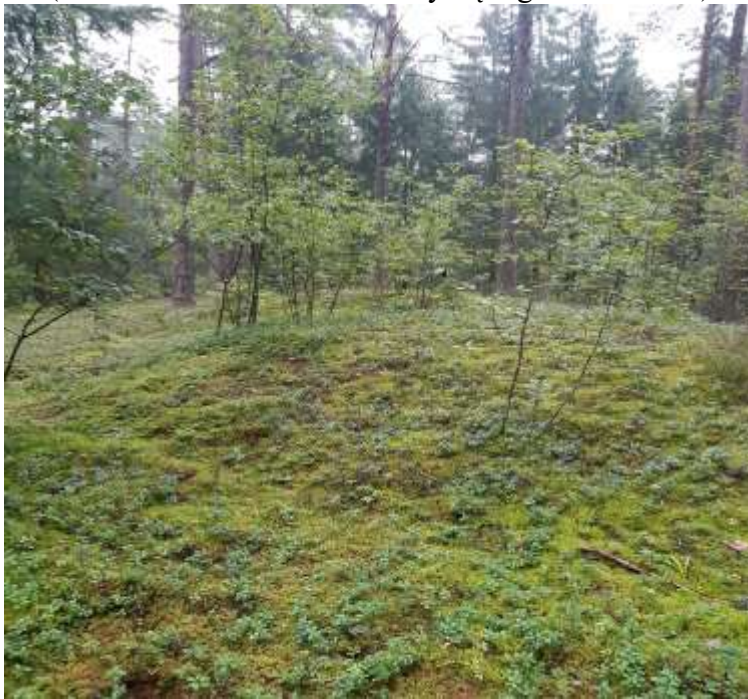
(unikalus kodas Kultūros vertybių registre – 13048)