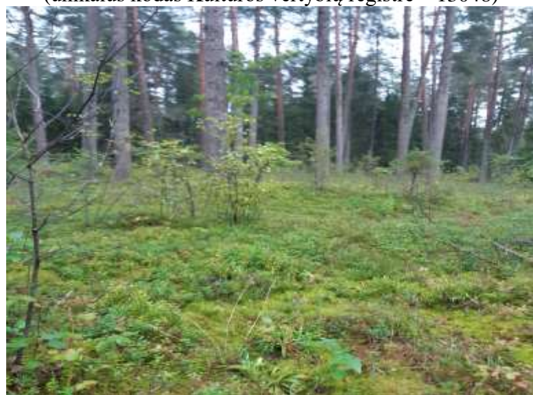
(unikalus kodas Kultūros vertybių registre – 13048)