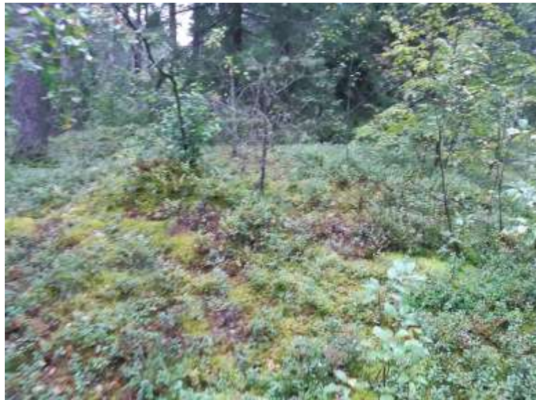
(unikalus kodas Kultūros vertybių registre – 13048)