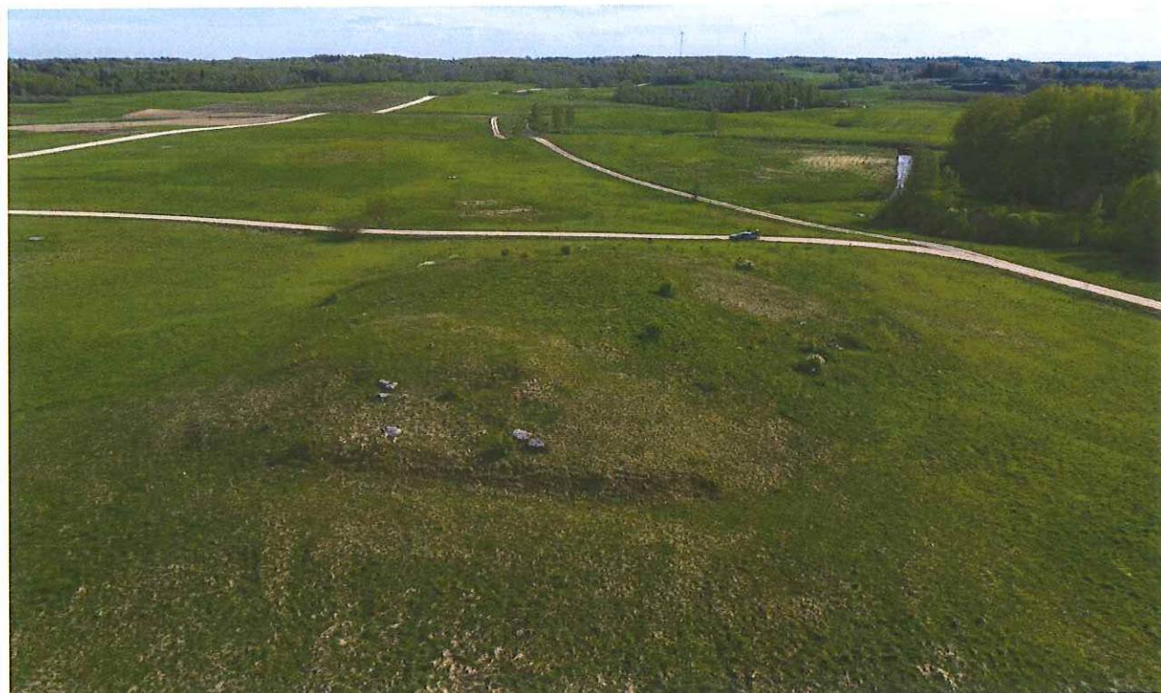
Unikalus kodas Kultūros vertybių registre – 12248