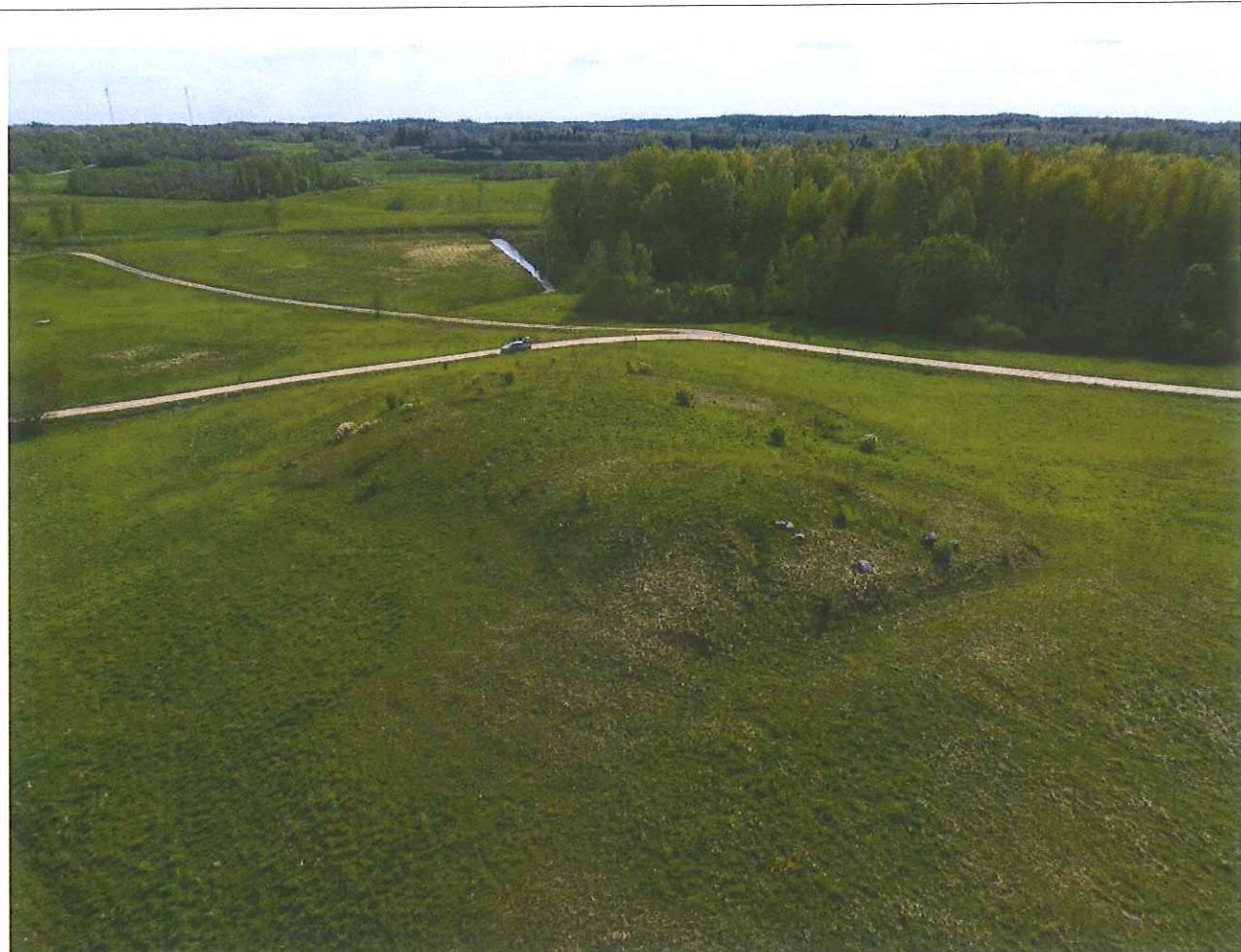
Unikalus kodas Kultūros vertybių registre – 12248