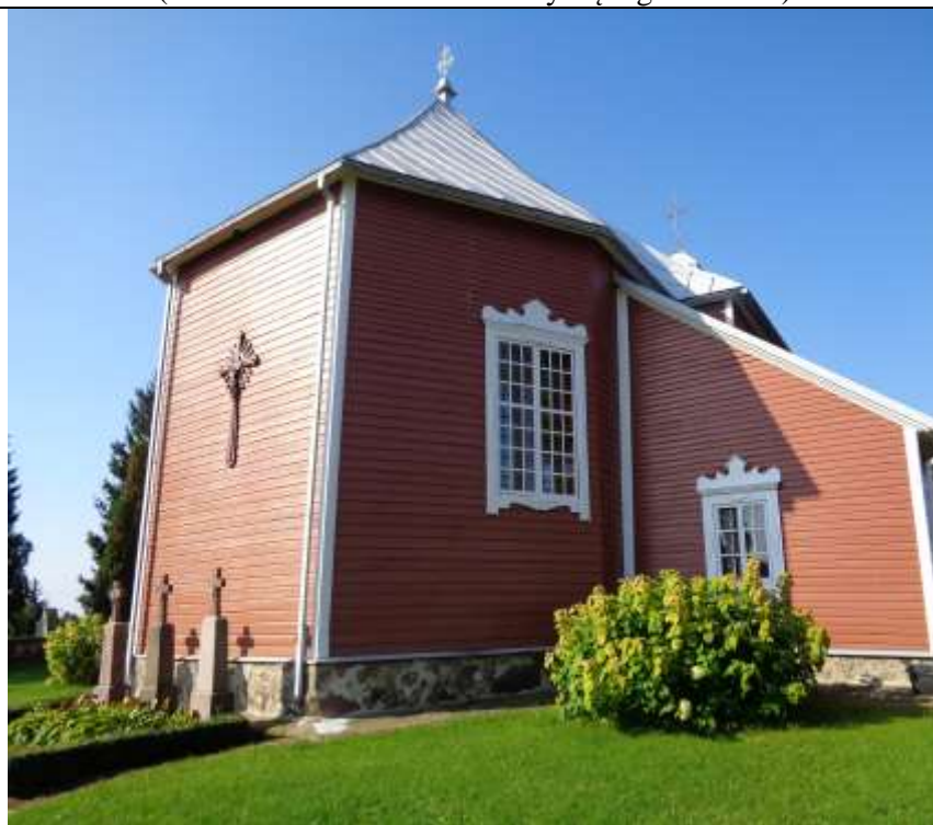
(Unikalus kodas Kultūros vertybių registre:1789)