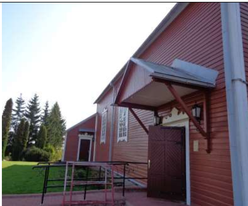
(Unikalus kodas Kultūros vertybių registre:1789)