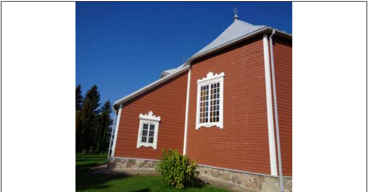
(Unikalus kodas Kultūros vertybių registre:1789)