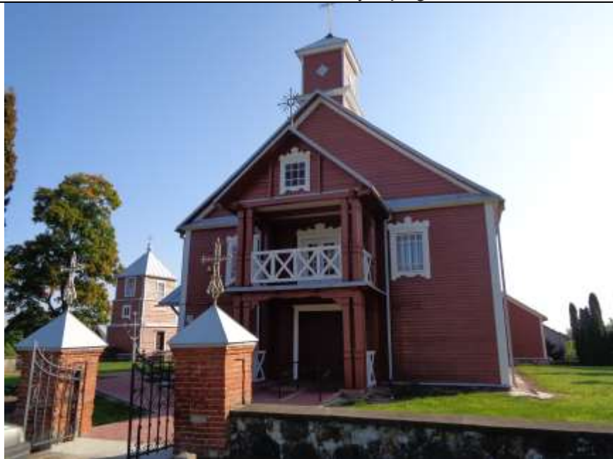
(Unikalus kodas Kultūros vertybių registre:1789)