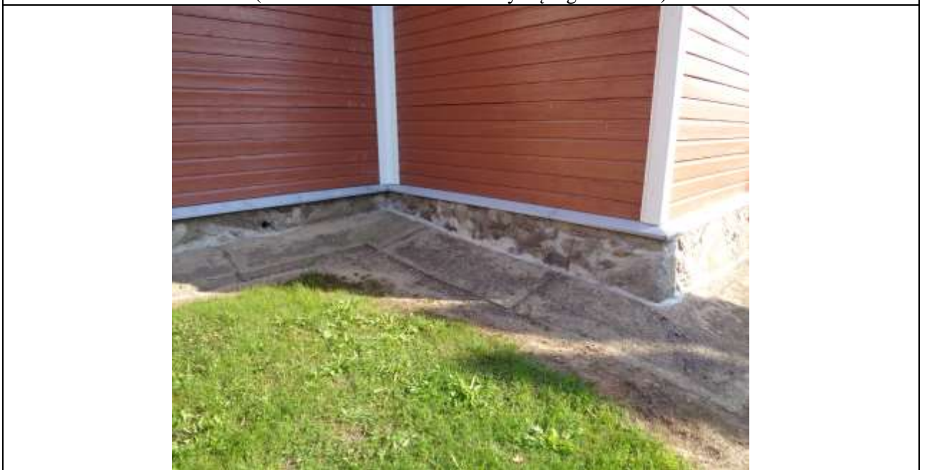
(Unikalus kodas Kultūros vertybių registre:1789)