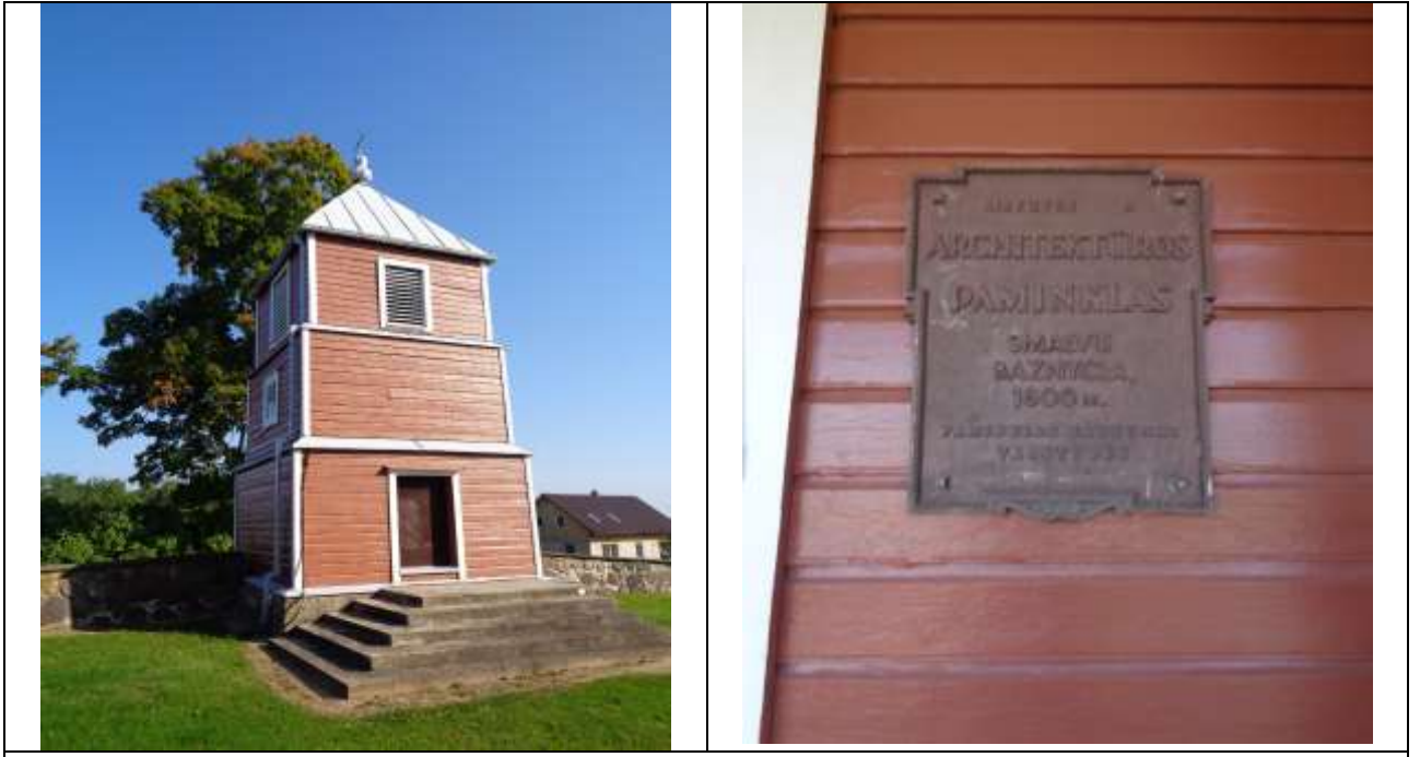
(Unikalus kodas Kultūros vertybių registre:1789)