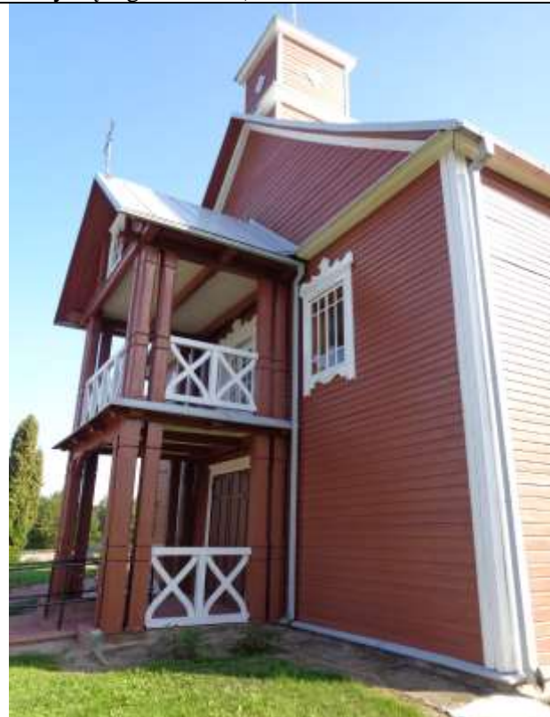
(Unikalus kodas Kultūros vertybių registre:1789)