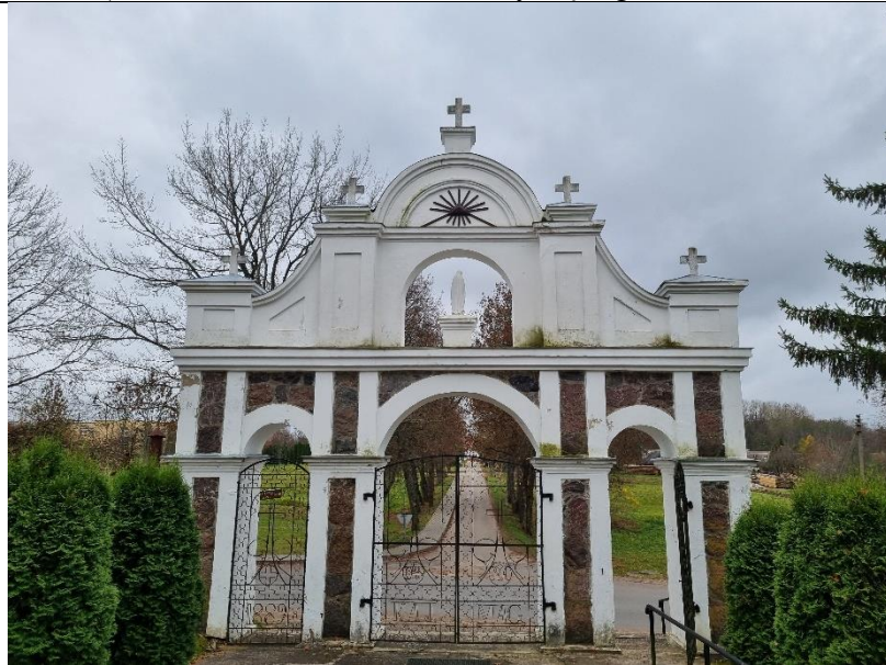
Unikalus kodas Kultūros vertybių registre – 23641