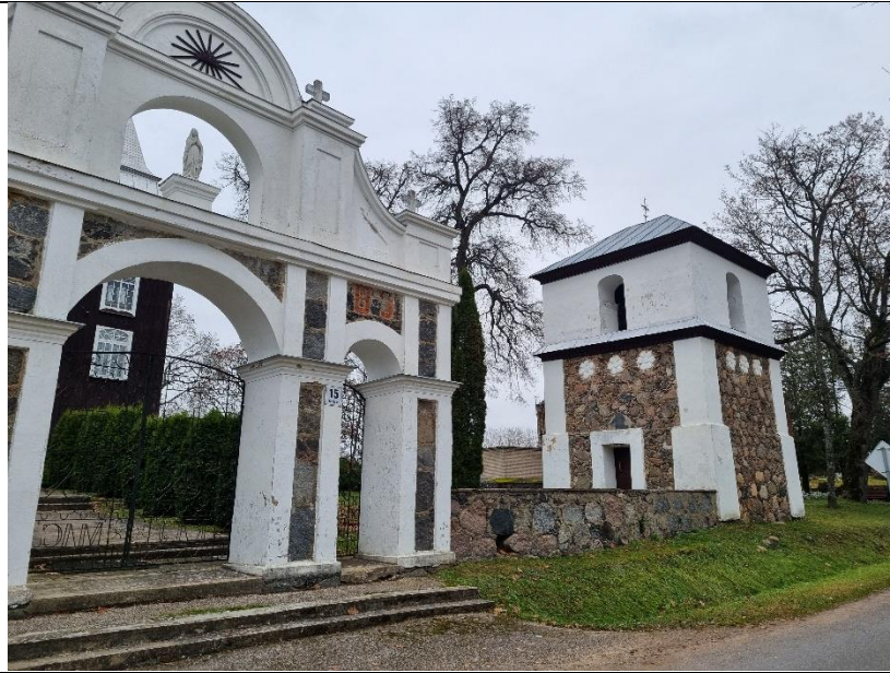
Unikalus kodas Kultūros vertybių registre – 23641