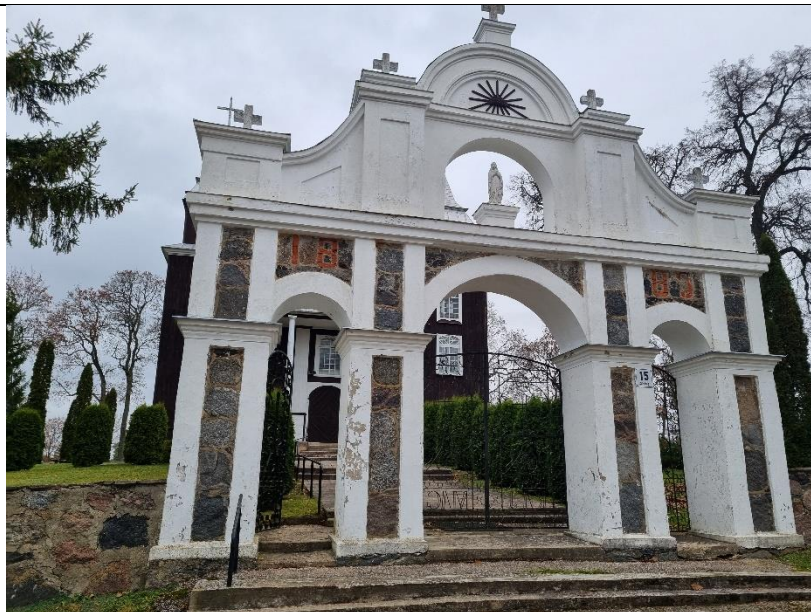
Unikalus kodas Kultūros vertybių registre – 23641