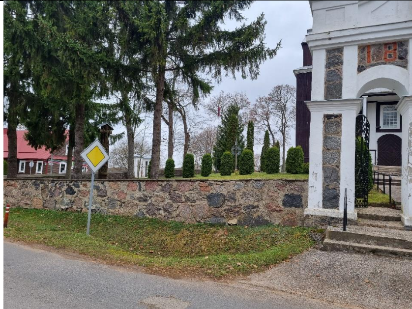
Unikalus kodas Kultūros vertybių registre – 23641