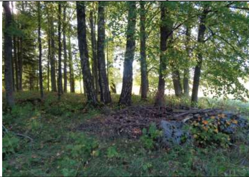
(unikalus kodas Kultūros vertybių registre – 24448)