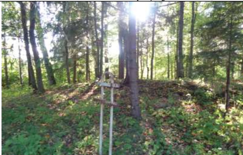
(unikalus kodas Kultūros vertybių registre – 24448)