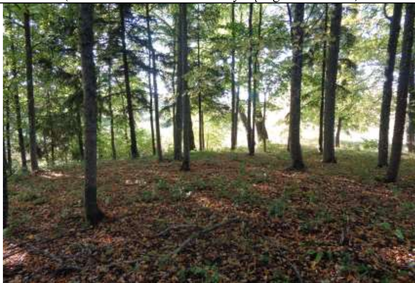
(unikalus kodas Kultūros vertybių registre – 24448)