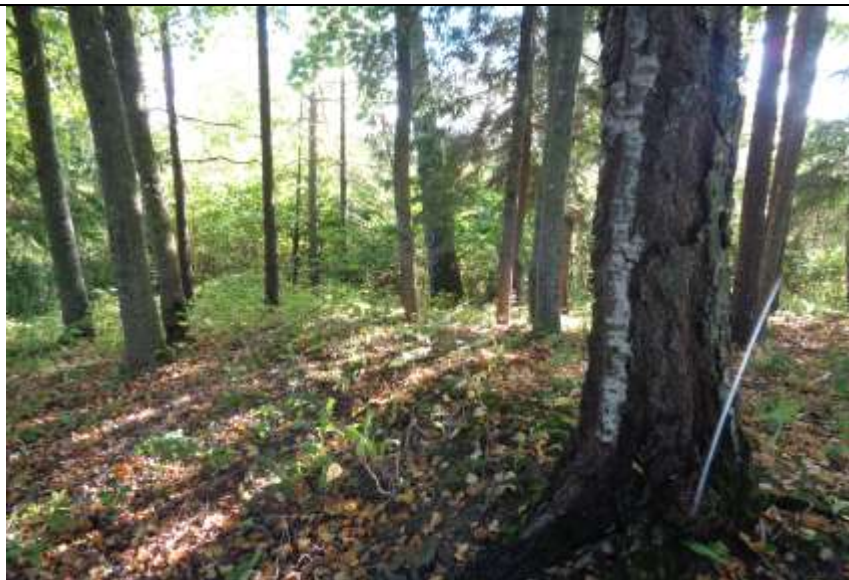
(unikalus kodas Kultūros vertybių registre – 24448)