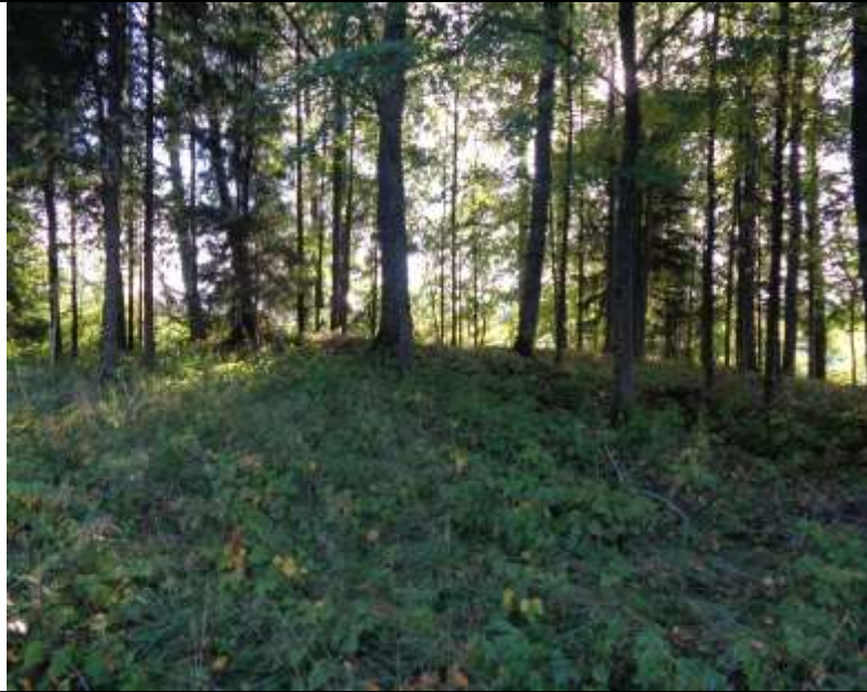
(unikalus kodas Kultūros vertybių registre – 24448)