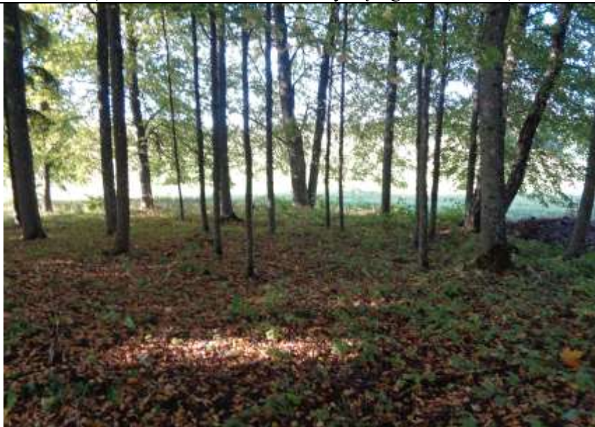
(unikalus kodas Kultūros vertybių registre – 24448)