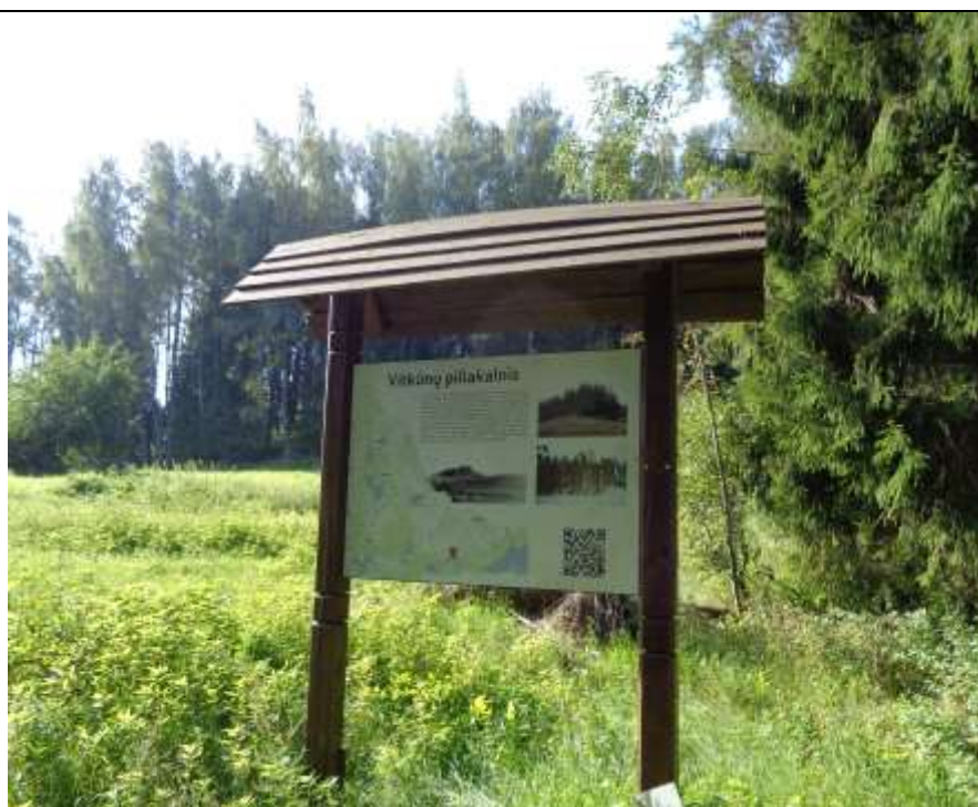
(Unikalus kodas Kultūros vertybių registre 5718)