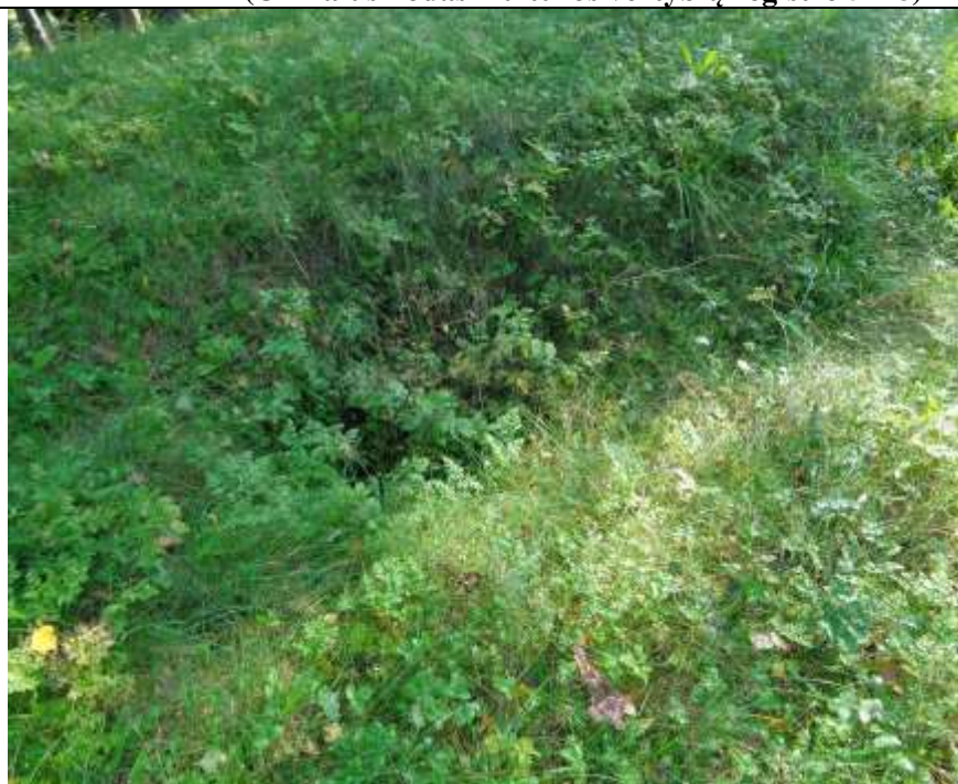
(Unikalus kodas Kultūros vertybių registre 5718)