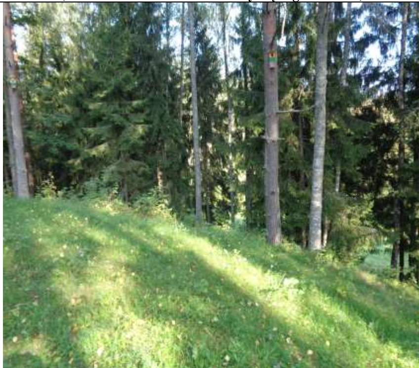
(Unikalus kodas Kultūros vertybių registre 5718)