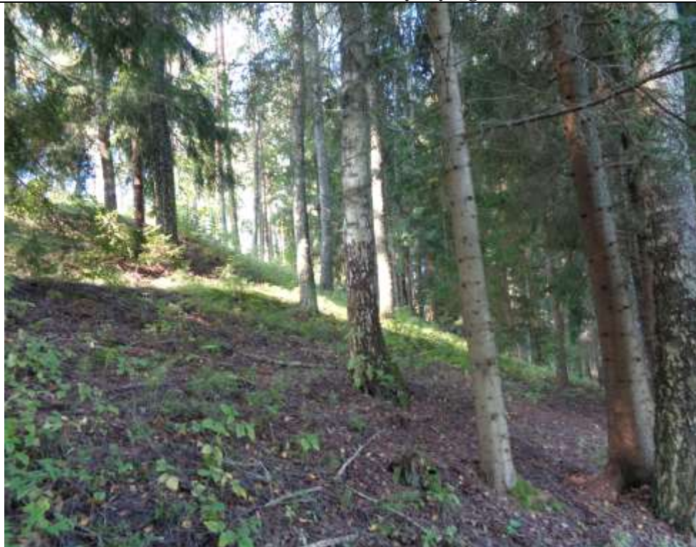
(Unikalus kodas Kultūros vertybių registre 5718)