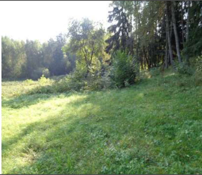
(Unikalus kodas Kultūros vertybių registre 5718)