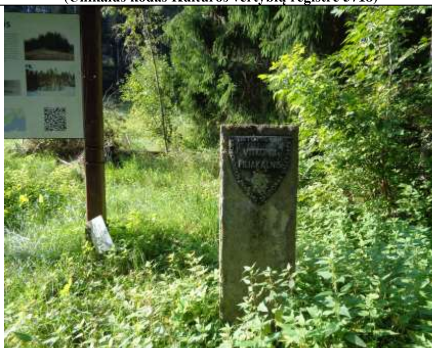
(Unikalus kodas Kultūros vertybių registre 5718)