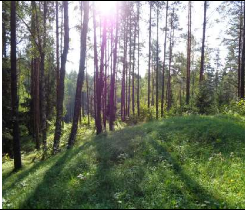
(Unikalus kodas Kultūros vertybių registre 5718)