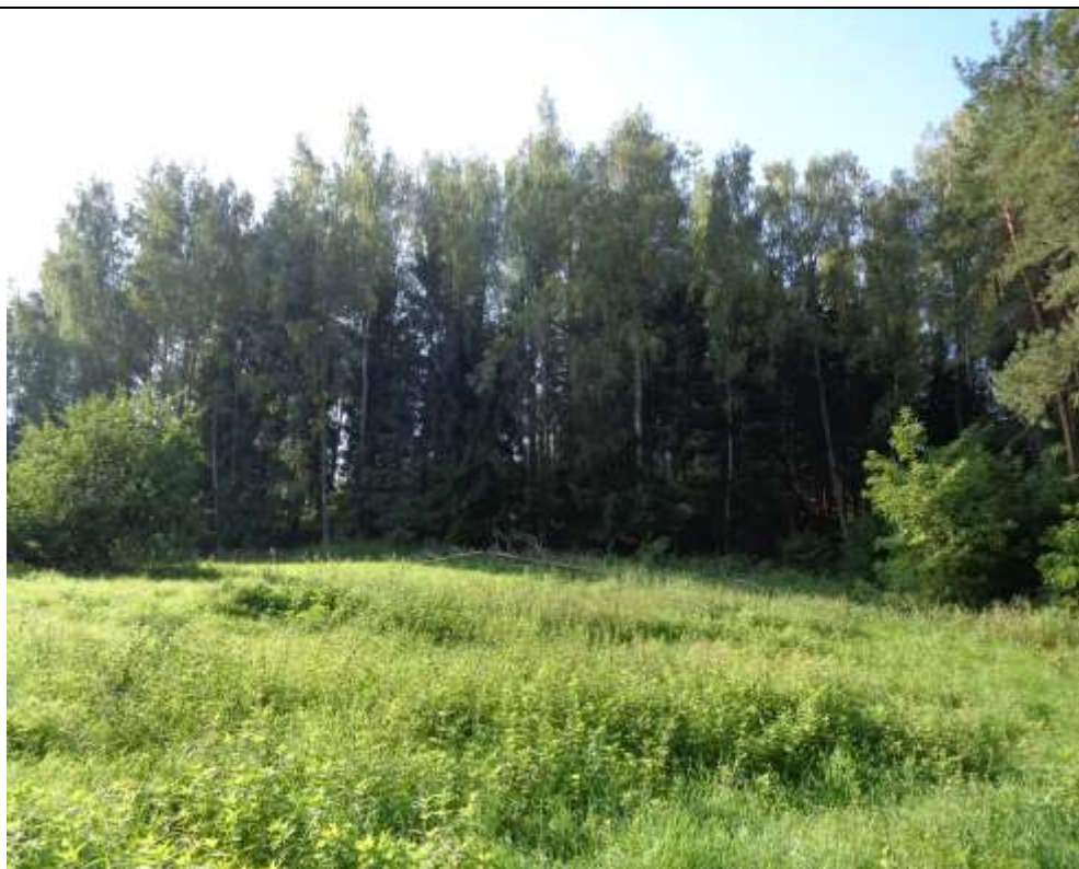
(Unikalus kodas Kultūros vertybių registre 5718)