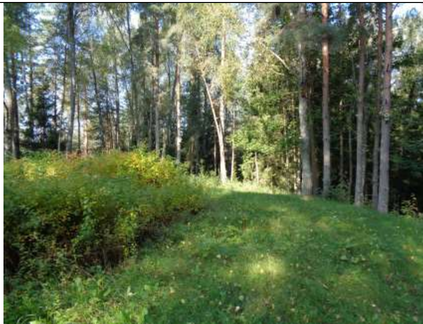
(Unikalus kodas Kultūros vertybių registre 5718)