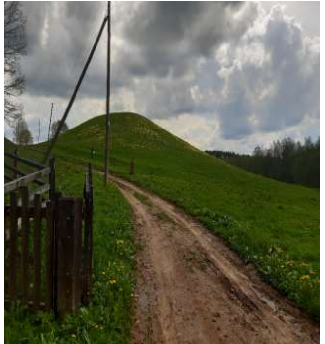
(unikalus objekto kodas 24091)