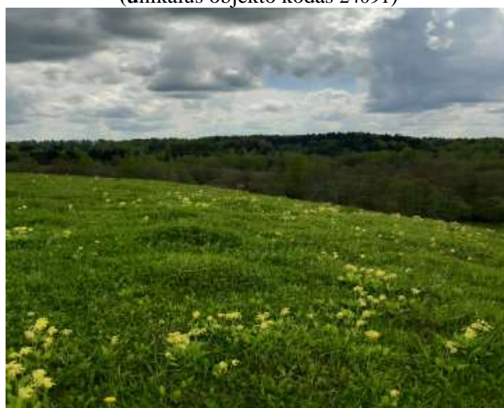
(unikalus objekto kodas 24091)