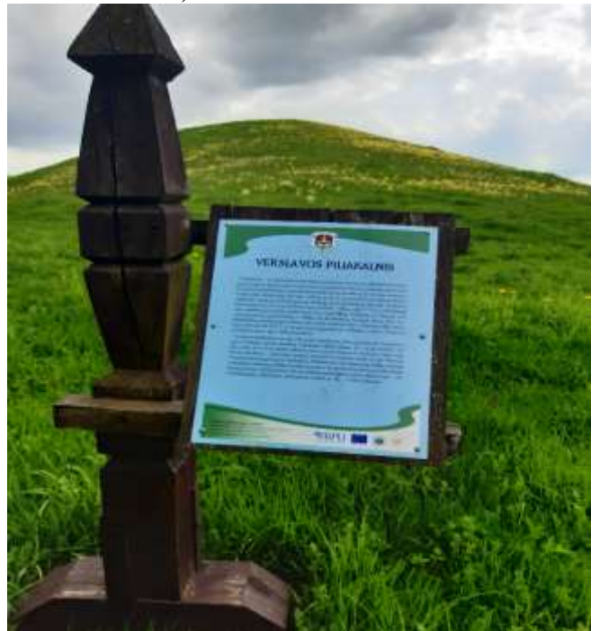
(unikalus objekto kodas 24091)