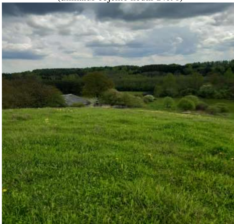
(unikalus objekto kodas 24091)