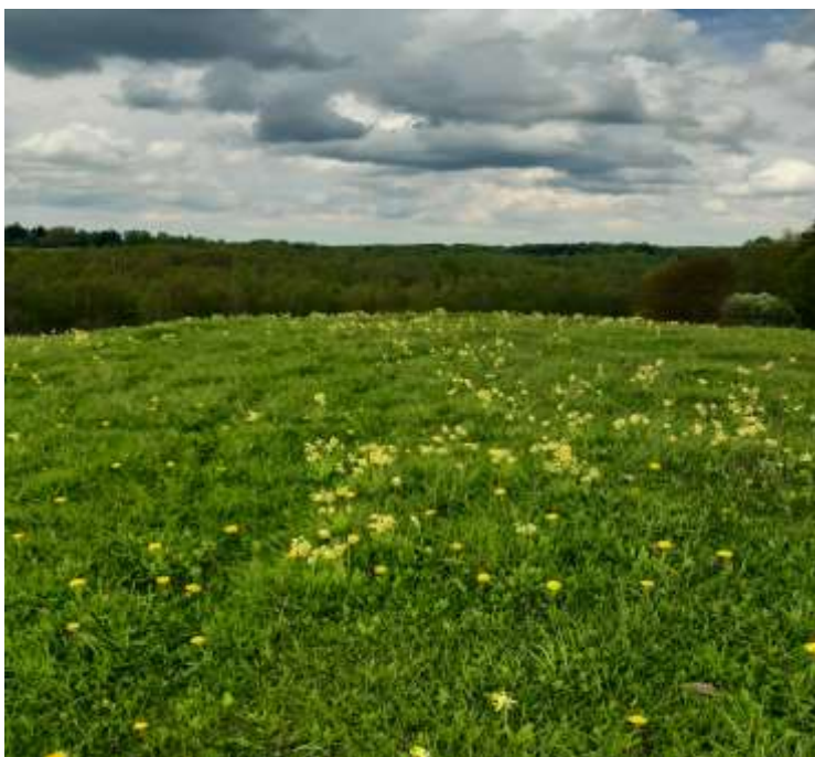
(unikalus objekto kodas 24091)