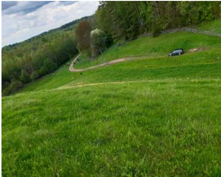
(unikalus objekto kodas 24092)