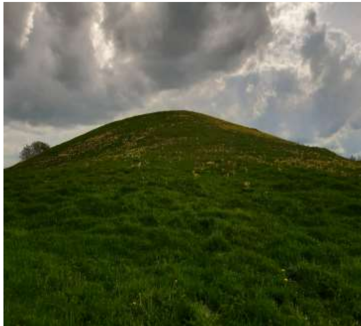
(unikalus objekto kodas 24092)