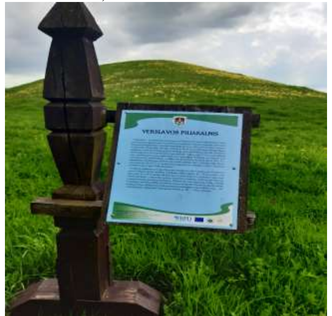
(unikalus objekto kodas 24092)