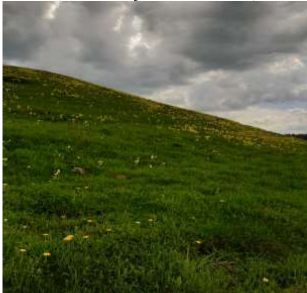
(unikalus objekto kodas 24092)