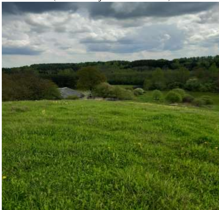
(unikalus objekto kodas 24092)