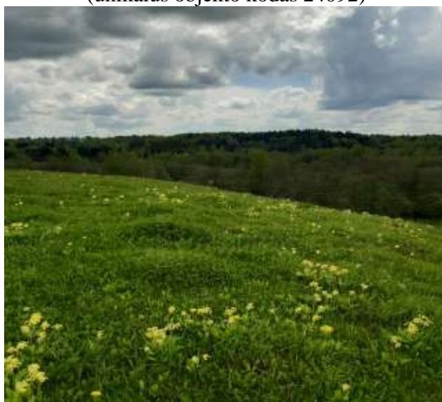
(unikalus objekto kodas 24092)