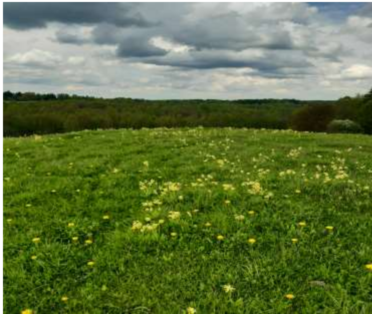
(unikalus objekto kodas 24092)