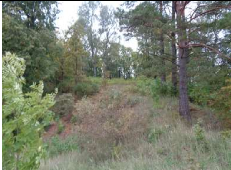
(unikalus kodas Kultūros vertybių registre – 21254)