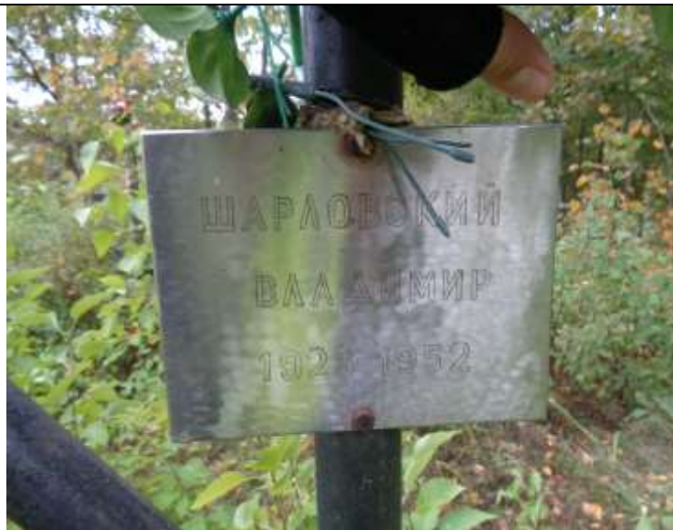
(unikalus kodas Kultūros vertybių registre – 21254)