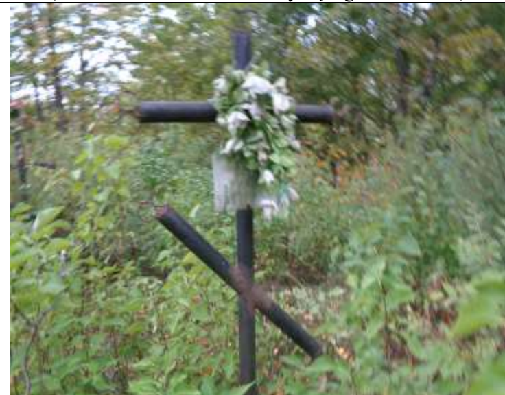
(unikalus kodas Kultūros vertybių registre – 21254)