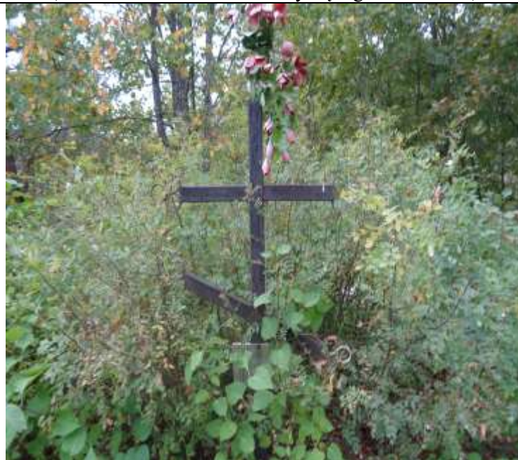
(unikalus kodas Kultūros vertybių registre – 21254)