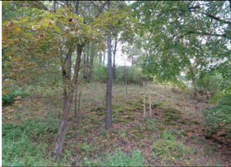
(unikalus kodas Kultūros vertybių registre – 21254)