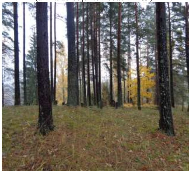
(unikalus objekto kodas 21269)