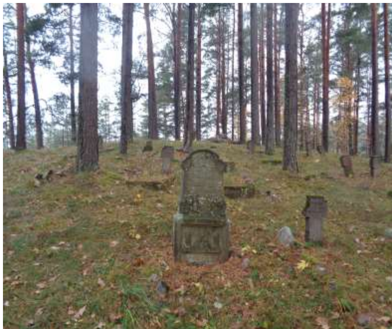
(unikalus objekto kodas 21269)