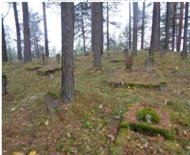
(unikalus objekto kodas 21269)