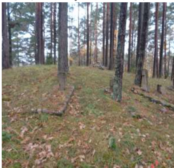
(unikalus objekto kodas 21269)