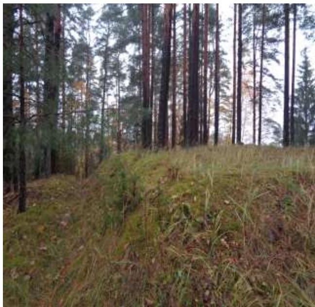
(unikalus objekto kodas 21269)