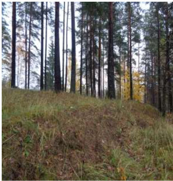
(unikalus objekto kodas 21269)