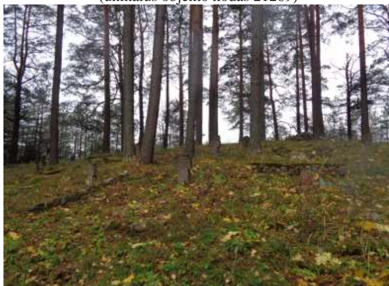
(unikalus objekto kodas 21269)