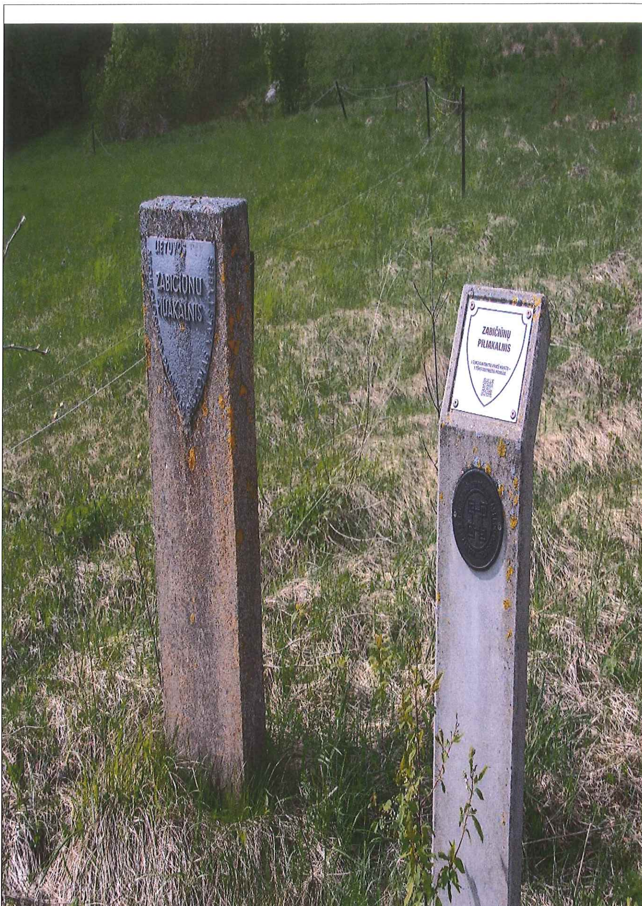
Unikalus kodas Kultūros vertybių registre – 5689