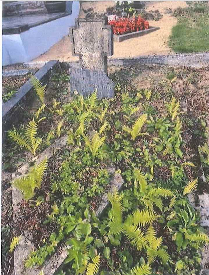
Unikalus kodas Kultūros vertybių registre – 40156