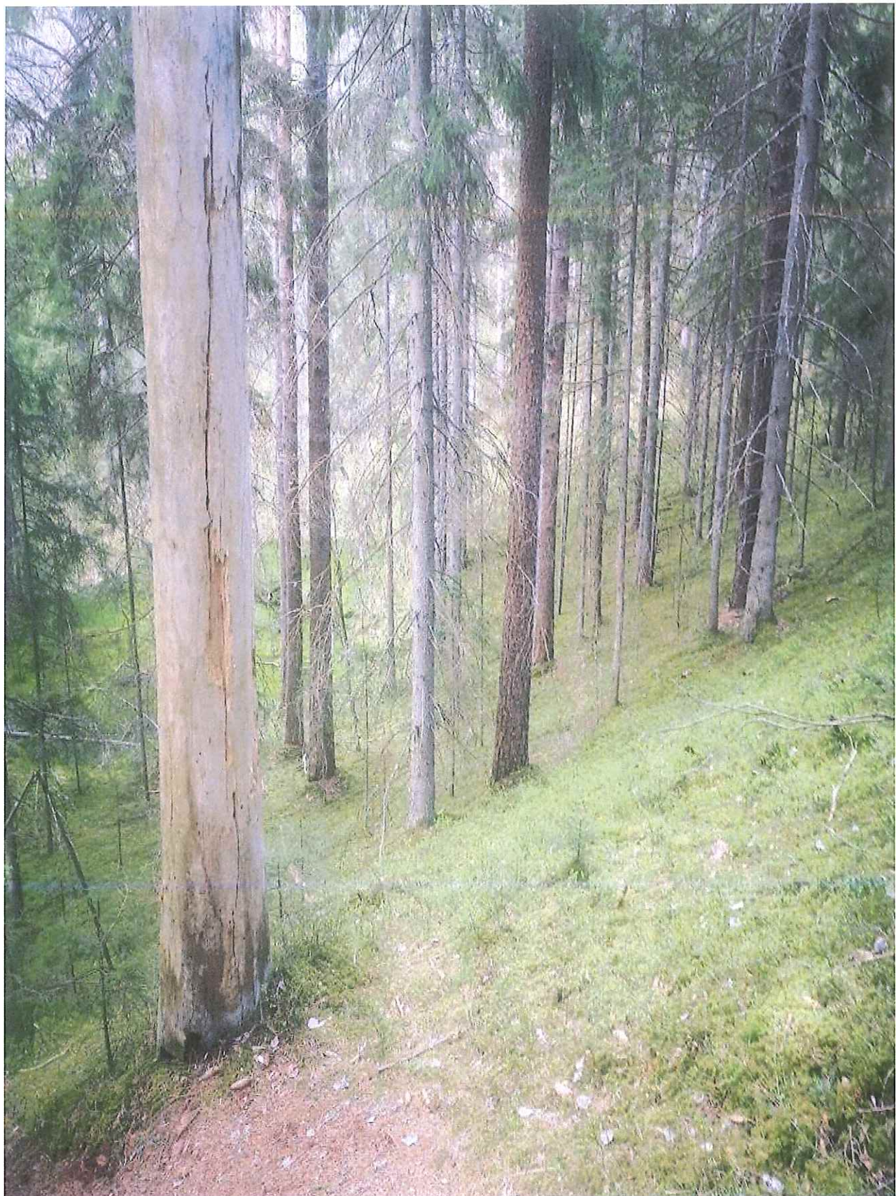
Unikalus kodas Kultūros vertybių registre – 5701