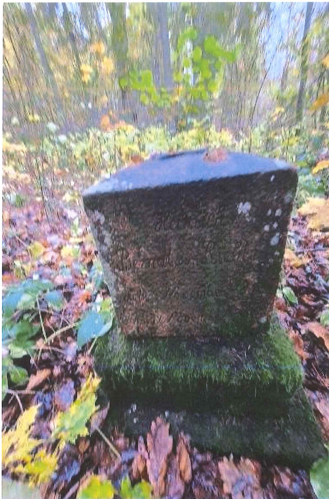
Unikalus kodas Kultūros vertybių registre – 21263