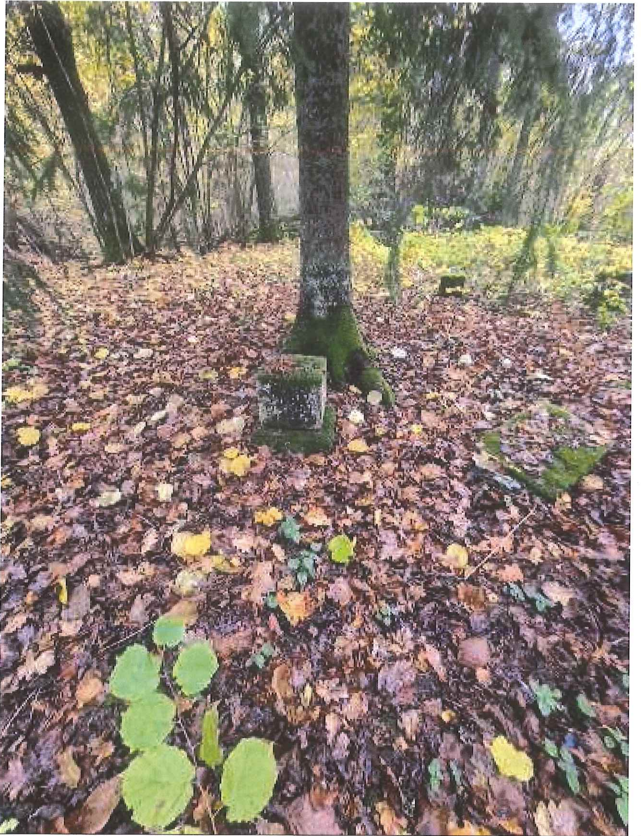
Unikalus kodas Kultūros vertybių registre – 21263