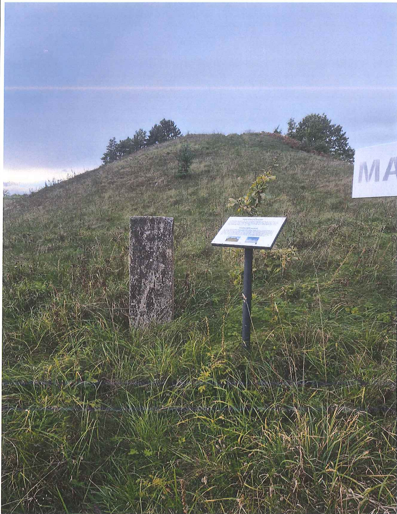
Unikalus kodas Kultūros vertybių registre – 24108