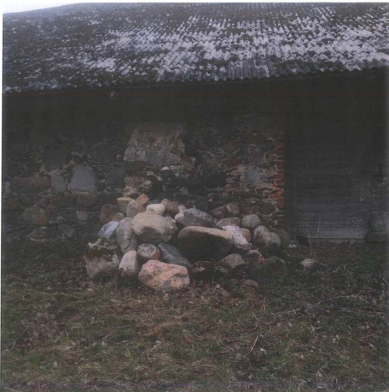
Unikalus kodas Kultūros vertybių registre – 38542