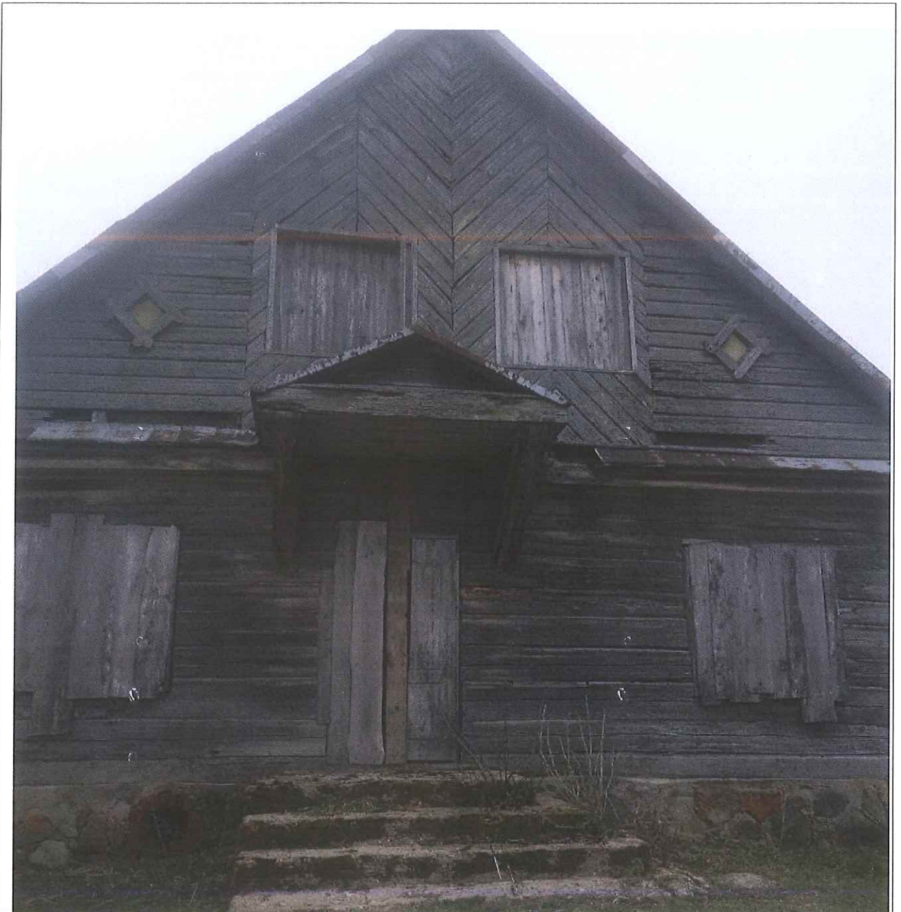
Unikalus kodas Kultūros vertybių registre – 38540