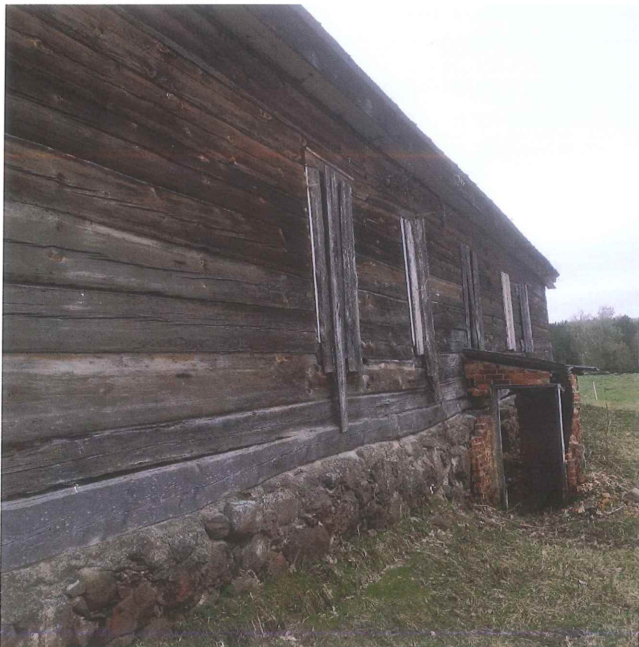
Unikalus kodas Kultūros vertybių registre – 38540